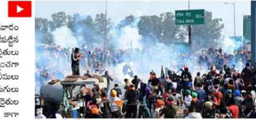
శంభూలో ఢిల్లీ సరిహద్దుల్లో పటిష్టమైన భద్రతా ఏర్పాటు చేశారు. రైతుల ఆందోళనకు సంబంధించి ఎవరైనా పుకార్లు పుట్టిస్తే తీవ్ర చర్యలు ఉంటాయని హెచ్చరించారు.

న్యూఢిల్లీ: తమ సమస్యలు పరిష్కరించాలని డిమాండ్ చేస్తూ శుభ్రవారం పంజాబ్-హర్యానా సరిహద్దు గల శంభూ సరిహద్దుల్లో రైతులు చేపట్టిన ఆందోళన ఉద్రిక్తంగా మారింది. వివిధ ప్రాంతాల నుంచి వచ్చిన రైతులు శంభూ సరిహద్దులకు చేరుకుని.. ఢిల్లీలోకి ప్రవేశించేందుకు ప్రయత్నించగా పోలీసులు అడ్డుకున్నారు. అందోళనకారులను చెదరగొట్టేందుకు పోలీసులు దీయర్ గ్యాస్ ప్రయోగించారు. దాంతో అందోళనకారులు పరుగులు తీశారు. పలువురు సామూహిక కిందపడిపోయారు. పోలీసులు, రైతుల ఉరుకులు, పరుగులతో ఆ ప్రాంతమంతా గందరగోళంగా మారింది. కాగా వ్యవసాయ సంస్కరణల ద్వారా తమకు జరిగిన నష్టానికి పరిహారం చెల్లించాలని, పంటలకు కనీస మద్దతు ధరకు చట్టబద్ధత కల్పించాలని డిమాండ్ చేస్తూ రైతులు ఆందోళనకు దిగారు. శుభ్రవారం చలో ఢిల్లీకి పిలువబడ్డారు.