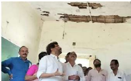
మనుజోలు (చైతన్యరథం): జిల్లా పరిషత్ ఉన్నత పాఠశాలల ప్రాంగణంలో నాడు-నేడు పనులను సర్వేపల్లి ఎమ్మెల్యే సోమిరెడ్డి చంద్రమోహన్ రెడ్డి శుభ్రవారం పరిశీలించారు. కంటపడిన లోపాలపై

- తూతూ మంత్రంగా పనులు... బిల్లుల పనులకన్నా విచారణ బరిపిస్తా సర్వేపల్లి ఎమ్మెల్యే సోమిరెడ్డి