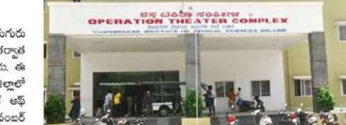
దిగ్గ్రాంతి వ్యక్తం చేశారు. జలాంటి పంజాబువారు ప్రజలు సహించరాదని, నిరసనలు తప్పవని అన్నారు. బాధితులకు ప్రభుత్వం ఇప్పటికే నష్టపరిహారం ప్రకటించిందిని తెలిపారు. ఇకపై ఎలాంటి మరణాలు సంభవించకుండా చూస్తామని హామీ ఇచ్చారు.