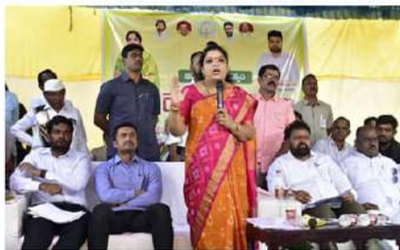
గ్రామసంచాయితీ ప్రతిపాదించిన పనులను మంజూరు చేస్తామని ఆమె తెలిపారు. ప్రతి ఒక్కరూ సంకేషంగా ఉండాలని ముఖ్యమంత్రి ఆశంక్షించారు. ఉచిత డింపింగ్ సిలిండర్లు జారీ చేశామని, రాష్ట్రంలో నెలకొల్పేందుకు చాలా కంపెనీలు ముందుకు వస్తున్నాయని ఆమె తెలిపారు.

జనవారం నిర్వహిస్తున్న మేగా పేరెంట్స్ మీటింగ్కు తదిదండ్లులు హాజరు కావాలని ఆమె విజ్ఞప్తి చేశారు. పిల్లలను ఆటలు ఆడేందుకు ప్రోత్సహించాలని ఆమె కల్లెడండ్లను కోరారు. కూర్కూసాగరం, జంపరకొట ప్రాజెక్టులను పూర్తి చేస్తామని, ఇది రైతు ప్రభుత్వమని ఆమె అన్నారు. 14, 15 డిసెంబర్ నిధులు విడుదల చేశామని, వాటి ద్వారా మంచి పనులు చేపట్టవచ్చని ఆమె తెలిపారు.