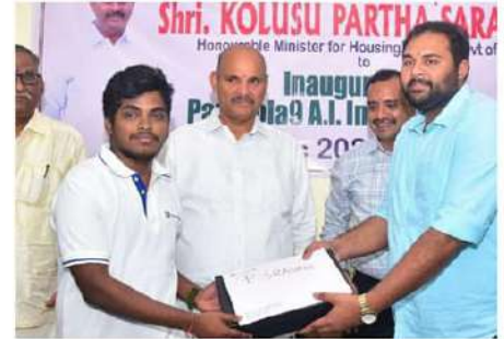
హామీ ఇచ్చారు. ఈ కార్యక్రమంలో పాఠాభిలా-9 సంస్థ ప్రతినిధులు, యువ పార్లమెంటుకే వేరే కొలుసు నిలివే కృష్ణ, తదితరులు పాల్గొన్నారు.

అనుసంధాన సంస్థగా తీర్చిదిద్దాలని మంత్రి సూచించారు. ఇక్కడ రిజిస్టర్ పొందిన విద్యార్థులు ప్రపంచ ప్రఖ్యాతి సాఫ్ట్వేర్ సంస్థల్లో సులువుగా ఉద్యోగం సంపాదించవచ్చన్నారు. ఈ సంస్థ ద్వారా విద్యార్థులకు వైపున ఉందిన అధ్యాపకులతో మంచి సాంకేతిక విద్యను అందిస్తారని, దీన్ని విద్యార్థులు సద్వినియోగం చేసుకోవాలని, రాజకీయలకలితంగా ఈ ఇన్స్టిట్యూట్ నడపాలని అధ్యాపకులకు, సిబ్బందికి మంత్రి సూచించారు. తనకున్న దేశ, విదేశాల పరిచయాలతో నూజివీడు ఆవిష్కరించిన సాఫ్ట్వేర్ సంస్థను ఇక్కడ విద్యార్థులు చేయించామన్నారు. కరోనా తరువాత సాఫ్ట్వేర్ రంగంలో సగానికి పైగా వర్షి ఫర్ హోమ్ జాబ్ చేస్తున్నారని, ఈ ఇన్స్టిట్యూట్ ద్వారా వైపున ఉంది ఇంది దగ్గరనుండి జాబ్ చేసుకోనే అవకాశం వుంటుందని మంత్రి తెలియజేశారు. ఇప్పటికే నూజివీడు ట్రిపుల్ ఐటీలో మెన్, క్యూడీస్, ఛానిటీషన్, సహా పలు సమస్యలను పరిష్కరించామన్నారు. త్వరలో క్రికెట్ స్టేడియం నిర్మిస్తామని, డ్రైనేజ్ వ్యవస్థను మెరుగు పరుస్తామని, సోలార్ విద్యుత్ తో వేదీనిరు, సురక్షిత తాగునీరు అందించి విద్యార్థుల సమస్యలన్నింటినీ పరిష్కరిస్తామని మంత్రి