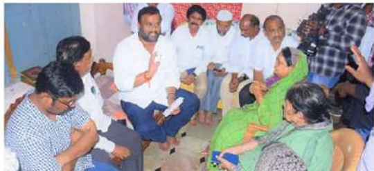
తెలుసుకుంటామన్నారు. ఉర్దూ పాఠశాల లో అందరితో ఆప్యాయంగా, మంచిగా మాట్లాడే ఒక మంచి ఉపాధ్యాయుడిని కోల్పోయామన్నారు. ఆయన పవిత్ర ఆత్మకు శాంతి కలగాలని, వారి కుటుంబం సభ్యులకు కష్ట ప్రస్థానం సానుభూతిని తెలియజేస్తున్నామన్నారు. ఈ కార్యక్రమంలో స్థానిక నాయకులు, ఉపాధ్యాయులు అభిమానులు పాల్గొన్నారు.