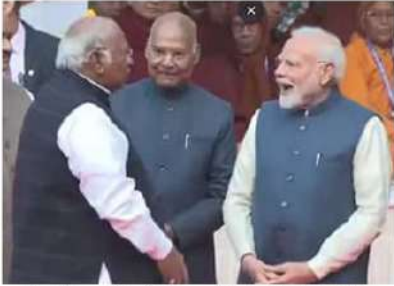
న్యూఢిల్లీ: డాక్టర్ బీఆర్ అంబేద్కర్ వర్తతి సందర్భంగా పార్లమెంటు ఆవరణలో శుభ్రవారం మహాపరిస్థితి దివస్ నిర్వహించారు. ప్రధాని నరేంద్ర మోదీ అంబేద్కర్ చిత్రపటానికి

నివాళులర్పించారు. ఈ సందర్భంగా అత్యధిక ఆసక్తికర సన్నివేశం చోటుచేసుకుంది. ప్రధాని మోదీ, కాంగ్రెస్ జాతీయ అధ్యక్షుడు మల్లికార్జున ఖర్జే పరస్పరం పలకరించుకొని కాసేపు నవ్వుతూ మాట్లాడుకున్నారు. దీనికి సంబంధించిన దృశ్యాలు సామాజిక మాధ్యమాల్లో చక్కర్లు కొడుతున్నాయి.