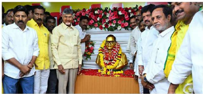
అంబేద్కర్ వర్ణం సంస్కరణ విశాఖ పార్టీ కార్యాలయంలో బాబా సాహెబ్ విగ్రహానికి పూలమాల వేసి నివాళి అర్పించిన ముఖ్యమంత్రి చంద్రబాబు నాయుడు.

మొంబడ్లు, సర్పంచులు, తదితర ప్రజాప్రతినిధులు వారికి దగ్గరలో ఉన్న పాఠశాలలో జరిగే సమావేశాల్లో పాల్గొంటారు. తల్లిదండ్రులు, స్వర్ణ విద్యార్థులు, సంబంధిత పాఠశాలల్లో వదివిన ప్రముఖులు, ప్రజాప్రతినిధులు, పాఠశాల నిర్వహణ కమిటీ (ఎన్ఎంసీ) సభ్యులు, తాతలు పెద్ద ఎత్తున ఈ కార్యక్రమంలో పాల్గొని విజయవంతం చేయాలని ప్రభుత్వం కోరుతోంది. ఇటువంటి కార్యక్రమాన్ని ఇప్పటికే చిన్న రాష్ట్రమైన ఢిల్లీలో నిర్వహించారు. పెద్ద రాష్ట్రాల్లో తొలిసారిగా ఆంధ్రప్రదేశ్లోనే నిర్వహిస్తున్నారు. శనివారం ఉదయం 9.00 గంటల నుండి మధ్యాహ్నం ఒంటి గంట వరకు రాష్ట్ర వ్యాప్తంగా ఆస్తి ప్రభుత్వ విద్యార్థి పాఠశాలల్లో పేరీఎంబు నిర్వహిస్తారు.