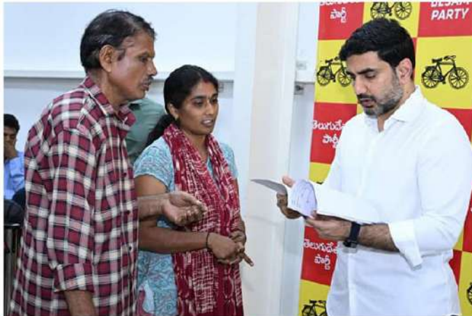
కలిసి ఫిర్యాదు చేశారు. మదనపల్లె రోడ్ నాన్ కట్టా సులోచనను బినామీగా పెట్టి ఫోర్వరీ డాక్యుమెంట్లతో పట్టణంలో రూ.10 కోట్ల విలువైన తమ 50 సెంటల భూమిని ఆక్రమించి వేదిస్తున్నారని మంత్రి ఎదుట కన్నీటిపర్యం కమయ్యారు. రెండు రోజుల క్రితం మాజీ మంత్రి పెద్దిరెడ్డి, సులోచన అనుచరులు తమ స్థలం లోకి దొర్లవ్వంగా ప్రవేశించి తాము నిర్మించుకున్న ప్రహారీ గోడ, సీసీ తెవెలూరు ధ్వంసం చేశారని ఆవేదన వ్యక్తం చేశారు. ప్రశ్నించిన తరువాత ఆక్రమ కేసులు పెట్టి వేధించడంతో పాటు అనుచరులతో ఘోరికదాదులకు దిగుతున్నారని వాపోయారు. పోలీసులకు ఫిర్యాదు చేసినప్పటికీ ఎలాంటి ఫలితం లేదన్నారు. విచారించి తమ భూములను కాపాడటంతో పాటు ప్రాణరక్షణ కల్పించాలని విజ్ఞప్తి చేశారు. పరిశీలించి తగిన చర్యలు తీసుకుంటామని మంత్రి లోకేష్ హామీ ఇచ్చారు.

అమరావతి (వైతన్యరథం): విద్య, బడి శాఖల మంత్రి నారా లోకేష్ ప్రజారద్దారి కు విన్నపాలు వెల్లువెత్తాయి. ఉండవల్లిలోని నినాపంలో 50వ రోజు ప్రజారద్దారి కు శుభాకాంక్షలను తెలిపే సందర్భంగా ప్రజల తరలి వచ్చి, మంత్రి లోకేష్ ను కలిసి తాము ఎదుర్కొంటున్న సమస్యలను విన్నవించారు. ప్రతి ఒక్కరి విజ్ఞప్తిని పరిశీలించిన మంత్రి.. ఆయా సమస్యల పరిష్కారానికి కృషి చేస్తామని హామీ ఇచ్చారు. వైసీపీ పాలనలో మంత్రిగా పనిచేసిన పెద్దిరెడ్డి రామచంద్రారెడ్డి అధికారం అంతలో అన్నయ్య జిల్లా పరిషత్తులో 15 కుటుంబాలకు చెందిన రూ.200 కోట్ల విలువైన భూములను నకిలీ పత్రాలు సృష్టించి కల్లా చేశారని పట్టణానికి చెందిన బాసాని సునీల్ రెడ్డి గోపాలయ్యారు దంపతులు.. మంత్రి నారా లోకేష్ ను