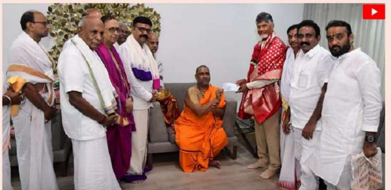
రాజధాని అమరావతి నిర్మాణ మహాత్మాస్వారి తమంతంగా రూ.50 లక్షల విరాళాన్ని అందించారు మంత్రాలయం శ్రీ గురు రాఘవేంద్ర స్వామి మఠం మేధావతి శ్రీ శ్రీ సుబ్రహ్మణ్యం. బుధవారం ఉండవల్లి ముఖ్యమంత్రి నివాసంలో సీఎం చంద్రబాబు కలిసిన సుబ్రహ్మణ్య స్వామి విరాళం చెక్కును స్వయంగా ముఖ్యమంత్రి అందిస్తూ, నిరంకుశంగా అమరావతి నిర్మాణం సాగించి అక్కర్లయినవి అందించిన విరాళంపై, ఆయన ఎలవారానికీ ముఖ్యమంత్రి చంద్రబాబు కృతజ్ఞతలు తెలిపారు.

చేయాలన్నారు. గత ప్రభుత్వంలో కొనుగోలు చేసిన కైలం కూడా ధాన్యం దబ్బులు కైలంలకు అందేవి కావని, కానీ కూటమి ప్రభుత్వం అధికారంలోకి వచ్చాక 24 గంటల్లోపే ధాన్యం దబ్బులు కైలంలకు భాతాల్లో వేస్తున్నామని, దీన్ని పూర్తిస్థాయిలో అమలు చేస్తామన్నారు. ధాన్యం సంచలన సమస్యలు కలిగి ఉన్నప్పుడు చూడాలని బాధ్యత అధికారులదేనన్నారు. గత ప్రభుత్వం గతేడాది 71,002 మంది కైలంలనుండి 4,43,904 మెట్రిక్ టన్నుల ధాన్యాన్ని కైలంల నుండి కొనుగోలు చేయగా... ఈ యేడాది అప్పటి వరకు 1,30,580 మంది కైలంల నుండి 9,14,680 మెట్రిక్ టన్నుల ధాన్యాన్ని కొనుగోలు చేసి సకాలంలోనే దబ్బులు కైలంలకు అందించామని అధికారులు వివరించారు.