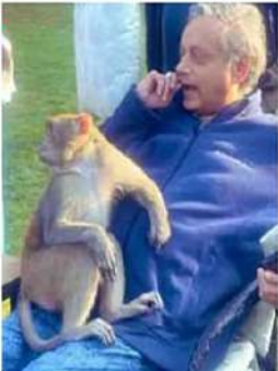
నమ్మకం కలిగింది. సామ్యంగా ఈ అనుభూతి కలిగిందంటూ నేను సంతోషిస్తున్నా' అని పేర్కొన్నారు.

నా ఒడిలో కూర్చోంది. రెండు అరటిపండ్లు ఇవ్వగా చాలా అతరితో రింది. నన్ను తొగిలించుకుని నా ధాటిపై రల ఆనింది నిద్రపోయింది. నేను మెల్లగా పైకి లేచగా కిందకు దూకి అక్కడి నుంచి వెళ్లిపోయింది' అని పేర్కొన్నారు. కాగా, వన్యప్రాణుల చట్ట గౌరవం మనలో పాతుకుపోయిందని శశి ధరూర్ తెలిపారు. అయితే ఆ కోతి కరుణించడమేనని తాను కొంచెం అందోషం చెందినట్లు చెప్పారు. కానీ ప్రశాంతంగా ఉండి దాని చర్యలను గమనించినట్లు వెల్లడించారు. 'ఆ కోతి నుంచి ఎలాంటి ప్రమాదం లేదన్న