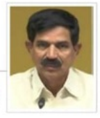
- గురజాల మార్కెట్, చైర్మన్, డిపీ సాక్షి సెంటర్