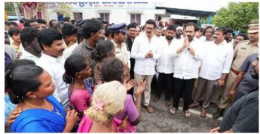
కొత్త కాలువ, కోడూరుపాడు

తిరుపతి (చైతన్యరథం): ఎన్నియే కూటమి ప్రభుత్వం ప్రజలకు ఇచ్చిన హామీ ప్రకారం పాలన సాగిస్తోంది ఇందులో భాగంగా ఎన్నికల ముందు ముఖ్యమంత్రి చంద్రబాబు నాయుడు డిప్యూటీ సీఎం పవన్ కళ్యాణ్ ఐటీ మంత్రి లోకేష్ శ్రీవారి దర్శనాన్ని స్థానికులకు కేటాయిస్తున్న ప్రతి నెలలో తొలి మంగళవారం శ్రీవారి దర్శనం కల్పిస్తామని ఇచ్చిన హామీని డిసెంబర్ నెలలో అమలు చేయడం సంతోషకరమని చంద్రగిరి ఎమ్మెల్యే నాని కూటమి ప్రభుత్వానికి కృతజ్ఞతలు తెలియజేశారు. సోమవారం సాయంత్రం విలేజరులు సమావేశంలో మాట్లాడారు. తొలి మంగళవారం తిరుపతి వహి ఆడిటోరియం నుంచి డిసెంబర్ 3న స్థానికులకు శ్రీవారి దర్శనానికి డిప్యూటీ జూరీ చేయడంపై ప్రభుత్వానికి ధన్యవాదాలు తెలిపారు. డిసెంబర్ ప్రజల ప్రభుత్వమని కానియాదారు. చంద్రగిరి మాజీ ఎమ్మెల్యే చెవిరెడ్డి ప్రజలను బానిసలుగా చూసారే తప్ప ప్రజల అవసరాలు ఏనాడూ తీర్చ లేదన్నారు. 37 మందికి పైగా కేసులు పెట్టించారన్నారు వైసీపీ నాయకులు చెవిరెడ్డి మాటలు నమ్మి మోసపోకందని సూచించారు. 2014-2019వరకు డిసెంబర్ ప్రభుత్వం స్థానికులకు శ్రీవారి దర్శనం కల్పించినదన్నారు ఆ తర్వాత 2019-2024లో గత ప్రభుత్వం అమలు చేయలేదన్నారు. ఇటీవల ముఖ్యమంత్రి చంద్రబాబు చంద్రగిరికి వచ్చినపుడు అధికారులతో పలు అభివృద్ధి కార్యక్రమా లపై చర్చించామన్నారు. ఐటీ రంగం, ఎలక్ట్రానిక్స్, రైతు సమస్యలపై చర్చ జరిగిందన్నారు. విలేజరుల సమావేశంలో డిసెంబర్ నాయకులు పాల్గొన్నారు.