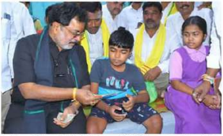
కల్వాలదుర్గం (చైతన్యరథం) : అనంతపురం జిల్లా కల్వాలదుర్గం మునిసిపాలిటీ పరిధిలోని కోట వీధిలో ఎమ్మెల్యే అమిలినేని సురేంద్ర బాబు సామాజిక భద్రత ఎస్టిఆర్ భరోసా పింఛన్ను పంపిణీ చేశారు. ఎమ్మెల్యే

అమిలినేనికి అంజనేయ స్వామి ఆలయం వద్ద పూర్వకంఠంలో స్వాగతం పలికిన డి.డి.పి నాయకులు అనంతరం అంజనేయ స్వామి ఆలయంలో ప్రత్యేక పూజలు చేసి స్వామి వారి ఆశీర్వాదం అందుకున్నారు... కానీలో పలు ఇళ్లకు వెళ్లి స్వయంగా పింఛన్ను అందజేశారు. ఒకటో తేదీ అదివారం కావడంతో ముందు రోజేనే పింఛన్ను పంపిణీ చేయడం జరిగింది. ఈ సందర్భంగా ఎమ్మెల్యే అమిలినేని మాట్లాడుతూ గత ప్రభుత్వంలో 3000 రూపాయలు పింఛన్ అందించడానికి ప్రతి ఏడాది 250 రూపాయలు పెంచుతూ ఐదేళ్లకు ఇచ్చారని గుర్తు చేశారు. కానీ తెలుగుదేశం ప్రభుత్వం అధికారంలోకి వచ్చిన వెంటనే ఎన్నికల్లో ఇచ్చిన హామీ మేరకు 4000 రూపాయలు అందించారన్నారు. ఒకటో తేదీ అదివారం అయితే ముందు రోజే పింఛన్ను పంపిణీ చేయాలని ముఖ్యమంత్రి నిర్ణయం తీసుకుని ఆయనకు తమను కూడా భాగస్వాములను చేసి పింఛన్ను పంపిణీలో ఎలాంటి ఇబ్బందులు లేకుండా అందిస్తుండటం చాలా సంతోషంగా ఉందన్నారు.