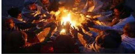
పడుతున్నారు. ఉదయం పది గంటల వరకు చలితీవ్రత తగ్గడం లేదు. మధ్యాహ్నం మూడు గంటల నుంచే మళ్లీ ప్రారంభమవుతోంది. చలిమంటలతో పలువురు ఉపకమనం పొందుతున్నారు.