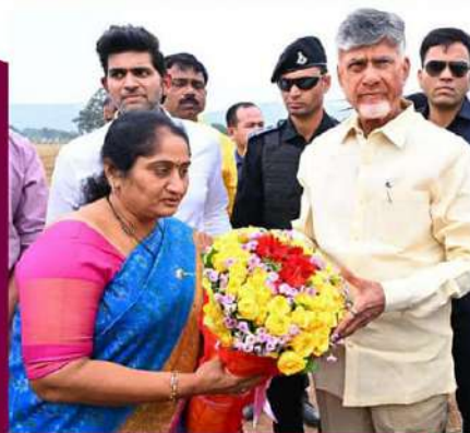
అనంతపురం జిల్లా రాయదుర్గం నియోజకవర్గం బొమ్మనహల్ మండలం నేమకల్లు గ్రామంలో అబ్బాదారులకు పంపాను పంపిణీ చేసిన, ప్రజావేదిక కార్యక్రమంలో పాల్గొనేందుకు వచ్చిన సీఎం చంద్రబాబుకు సాగ్నాతం పలుకుతున్న జిల్లాకు చెందిన ప్రజా ప్రతినిధులు, అధికారులు.