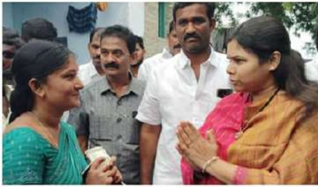
జిల్లాలోనే మొట్టమొదటి మివీ గోకులం ను ప్రారంభించడమైనది ఇవే కాదు అక్షగడ్డ తాలూకాలో అన్ని ఉన్నత అభివృద్ధి బాట పడతామని హామీ ఇచ్చారు. అలాగే అక్షగడ్డ రైతులు ఎవరూ ఇబ్బందులు పడకుండా తగిన చర్యలు తీసుకుంటామన్నారు. ఉద్యోగులవాడ మండలానికి లిఫ్ట్ అరిగేపనే కావాలని అడిగారు. రెండు నుంచి మూడు కోట్లు అవుతుందని మంత్రితో కలెక్టర్తో మాట్లాడి త్వరలోనే చేస్తామని తెలిపారు ఎటర్నల్ యువతకు కచ్చితంగా ధారి చూపిస్తామన్నారు. ఇటీవలే అక్షగడ్డ పట్టణంలో జాతీయ మేళా ఏర్పాటు చేసి అక్షగడ్డ తాలూకా నిరుద్యోగులకు 65 జాబులు ఇప్పించామని చెప్పారు. అక్షగడ్డ తాలూకాలో నిరుద్యోగ యువత ఎవరు ఉండకుండా చూసుకుంటామని హామీ ఇచ్చారు.

ప్రజలందరూ గ్రామస్థాయిలో అభివృద్ధి పథకాలు చూడలేకున్నారున్నారు. ఈ రోజు మివీ గోకులం నర్సాయి పల్లె గ్రామంలో