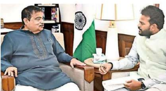
శ్రీకాకుళం (చైతన్యరథం): ఉత్తరాంధ్రలోని రహదారులను అభివృద్ధి చేయాలని కేంద్ర మంత్రి నితిన్ గడ్కరెడిని పొరవినయనకాళి మంత్రి కింకాపూ రామ్మోహన్నాయుడు కోరారు. ద్వితీయ కు క్రవారం ఆయనను కలిసి ఈ మేరకు

అనుసంధానం జరుగుతుందని వివరించారు. ఆలికాం-బద్రిలి రహదారి మినహానే ఒడిశాలోని పర్వతముంది వరకు రహదా సదుపాయం మెరుగుతుందని చెప్పారు. వాణికి మంత్రి సానుకూలంగా స్పందించాలని రామ్మోహన్ నాయుడు తెలిపారు. ఆదికాలయానికి ప్రసాద్ పథకం పర్యవేక్షణలో... అరసపల్లి సూర్యనారాయణ స్వామి దేవాలయానికి ప్రసాద్ పథకాన్ని వర్ధింపజేయాలని కేంద్ర వర్గాలకు, సాంస్కృతికశాఖ మంత్రి గజేంద్ర సింగ్ షెకావత్కు తెలిపామన్నాయుడు కోరారు. ఢిల్లీలో శుక్రవారం ఆయనను కలిసి శ్రీకాకుళం-పార్వతీపురం (సీఎస్సీ) రోడ్డును అభివృద్ధికి సంబంధించి రూపొందించిన టీఎం ద్వారా ఒడిశాలోని రాయగడ, చర్లిన గడ్డ రాజధాని రాయపూర్ రోడ్లతో