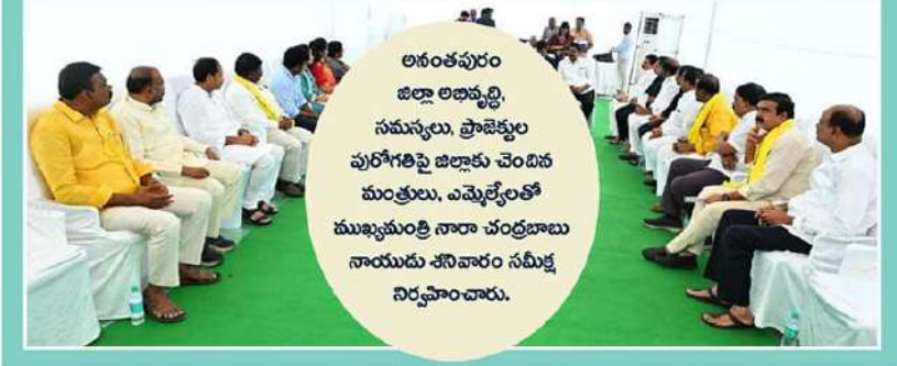
అనంతపురం జిల్లా అభివృద్ధి, సమస్యలు, ప్రాజెక్టుల పురోగతిపై జిల్లాకు చెందిన మంత్రులు, ఎమ్మెల్యేలతో ముఖ్యమంత్రి నారా చంద్రబాబు నాయుడు శనివారం సమీక్ష నిర్వహించారు.