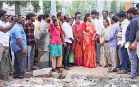
తీసుకోవాలని అధికారులను కోరారు. గత ప్రభుత్వం ఒక నెల పింఛన్ తీసుకోకపోతే ఆ డబ్బులు పేదలకు ఇవ్వకుండా ఎగడగట్టడం శింకనమల ఎమ్మెల్యే బండారు శ్రావణి విమర్శించారు. అయితే కూటమి ప్రభుత్వం అధికారంలోకి వచ్చిన తర్వాత ఒక నెల తీసుకోకపోతే వచ్చే నెలలో 2 నెలలు కలిపి పింఛన్ డబ్బులు ఇచ్చేలా నిర్ణయం తీసుకుందని చెప్పారు. అలాగే మూడు నెలల పింఛను కూడా ఒకే సెషా ఇవ్వమన్నామన్నారు. ఆ తర్వాత కూడా తీసుకోకపోతే లబ్ధిదారులు తిరిగి ధరభాషణ చేస్తే, పింఛన్ పునరుద్ధరణ చేయడం జరుగుతుంది. పేదల సంక్షేమం విషయంలో చంద్రబాబు నిబద్ధతకు ఇదే నిదర్శనమన్నారు. ఈ కార్యక్రమంలో డి.డి.పి నాయకులు, మండల అధికారులు, పంచాయతీ అధికారులు పాల్గొన్నారు.