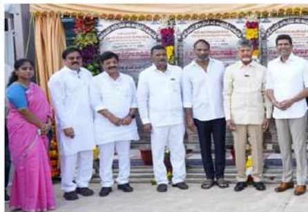
విద్యుత్ ఛార్జీలు పెంచడం వల్ల 1.53 కోట్ల మంది ప్రజలు ఇబ్బందిపడ్డారన్నారు. రాష్ట్ర విద్యుత్ రంగంలో ఎవరైనా పెట్టబడులు