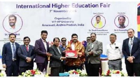
- వివరాలు 6లో..