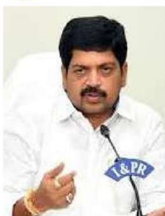
నివాసించడానికి ప్రభుత్వం అధిక ప్రాధాన్యత ఇస్తోందన్నారు. మధ్యం వినియోగదారుల ఆరోగ్యాన్ని కూడా దృష్టిలో పెట్టుకున్నాం. ప్రాథమిక స్థాయిలో ఎక్స్ట్రా సూపర్ అల్ట్రాలోపు ఇప్పటి వరకు 6 పారిశ్రామిక ద్వారా పరిశ్రమలు అనుమతించాం. ప్రస్తుతం వాటిని 13కు పెంచడం ప్రణాళితమే

ఉన్నతాధికారులతో గురువారం మంత్రి సమీక్షా సమావేశం నిర్వహించారు. ముఖ్యంగా బెల్టు షాపులు, ఎమ్మార్పీ ఉల్లంఘనలపై చర్చించారు. ఈ సందర్భంగా మంత్రి కొల్లు రవీంద్ర మాట్లాడుతూ... కొత్త మధ్యం పాలను అమలు, షాపుల కేటాయింపును పారదర్శకంగా ఫార్మి చేసేందుకు అధికారులను మనస్ఫూర్తిగా అభినందిస్తున్నట్లు తెలిపారు. 3396 మధ్యం షాపుల కేటాయింపులో ఎక్కువ ఎలాంటి వివాదాలకు లాభులేకుండా చేయడం సంకోచకరం అన్నారు. గత కొద్ది రోజులుగా మధ్యం షాపుల్లో ఎమ్మార్పీ ఉల్లంఘనలు, బెల్టు షాపుల ఏర్పాటుపై వస్తున్న ఆరోపణలపై అధికారులు తక్షణమే చర్యలు తీసుకోవాలని సూచించారు. బెల్టు షాపులు ఏర్పాటు చేసినట్లు తేలితే ఎంతటివారికైనా ఉపేక్షించాల్సి ఉంది. ఎక్స్ట్రా ఉల్లంఘనలు జరిగినట్లు గుర్తించే భారీ అవినాశాలతో పాటు కఠినమైన చర్యలు తప్పవని, మాట వినకుంటే షాపు లైసెన్సు కూడా రద్దు చేస్తామనే హెచ్చరిక షాపుల నిర్వాహకులందరికీ తెలియజేశారు.