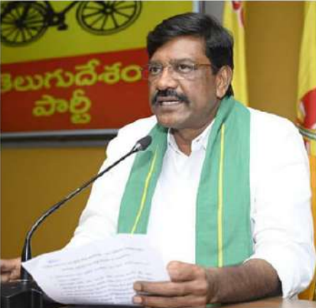
చెప్పారు. కొత్తగా పలువురికి వైద్య రంగంలో ఉద్యోగాలు కల్పించుతున్నామని చెప్పారు. ఆ రాష్ట్రంలో వైద్యరంగంపై ప్రభుత్వం ప్రత్యేక శ్రద్ధ పెట్టి ప్రజలందరికీ మెరుగైన వైద్యసేవలను అందించేందుకు కృషి చేస్తోందన్నారు.

వీరావురం ప్రాంత ప్రజలకు మెరుగైన వైద్య సేవలను అందించేందుకు 30 పడకల ఆసుపత్రిని 100 పడకల ఆసుపత్రిగా మార్చుతున్నామని