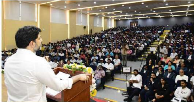
గెలుపే లక్ష్యంగా ముందుకు సాగాలి