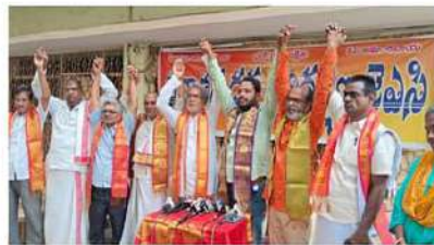
తల్లితగిన చేపట్టాలని కోరారు.