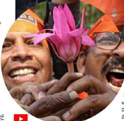
సాధించడం గమనార్హం. అందుకు బీజేపీ అనుసరిస్తోన్న సరికొత్త వ్యూహమే కారణమన్న చర్చ

అధికార 'మహాయుతి' ఆఖర విజయం సాధించింది. మహారాష్ట్ర ఎన్నికలలో సరికొత్త చరిత్రను రిథించింది. కొద్ది సేల క్రితం పార్లమెంట్ ఎన్నికలలో తగిలిన గాయంనుంచి త్వరితగోచరంగా కోలుకుని - విపక్ష మహా వికాస్ అభివృద్ధి రిలీఫ్ గిఫ్ట్ జర్రేపింది. పార్లమెంట్ ఎన్నికలలో పైచేయి సాధించిన మహా వికాస్ అభివృద్ధి - అసెంబ్లీ ఎన్నికలలో చిత్తుగా ఓడిపోయింది. కొంగ్రెస్ క్రెండ్ నమస్కృత్య నమయంలోనే - మహారాష్ట్ర ఎన్నికల ఫలితాలపై ఏపీ సీఎం చంద్రబాబు హర్షం వ్యక్తం చేశారు. ఘన విజయం దిశగా దూసుకెళ్తున్న 'మహాయుతి' కూటమికి శుభాకాంక్షలు ప్రకటించారు. కేంద్ర హోంమంత్రి అమిత్ షా, మహారాష్ట్ర సీఎం ఎక్నాథ్ షిండే, డిప్యూటీ సీఎం దేవేంద్ర ఫడ్డవిస్ కు స్వయంగా ఫోన్లు చేసి అభినందనలు తెలిపారు. ఎన్నికల్లో ప్రజలు అభ్యర్థన విజయం కట్టబెట్టటంతో శుభాకాంక్షలు చెప్పారు. ఆర్పిత క్రితం జరిగిన లోక్ సభ ఎన్నికల ఫలితాల్లో తగిలిన షాకాన్ని తోలుకుని భాజపా, షిండే శివసేన, అజిత్ పవార్ నేతృత్వంలోని ఎన్ డి టీతో కూడిన 'మహాయుతి' అనుభవ్య జయకేతనం ఎగురవేసింది. మహారాష్ట్రలో 288 స్థానాలకుగాను మహాయుతి కూటమి 232 స్థానాల్లో విజయం సాధించింది. అటు ప్రతిపక్ష మహావికాస్ అభివృద్ధి కూటమి 52 బిల్లు గెలుపొందింది. మహాయుతి కూటమిలో భాజపా ఆధిపత్య స్థానాలు