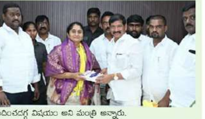
అభినందించడం విషయం అని మంత్రి అన్నారు.