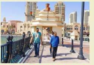
ఖతార్లో ఏపీటీడీసీ చైర్మన్ నూకసాని పర్యటన

తెలిపారు. గోదావరి వరద నీటిని పోలవరం ఎడమ కాలువ పనులు పూర్తి చేయడం ద్వారా ఉత్తరాంధ్రకు పంపిణీ చేసేలా ఆర్థిక ఇబ్బందులు ఉన్నా ఉత్తరాంధ్ర సుజల ప్రసంగి ప్రాజెక్టు కోసం ముఖ్య మంత్రి చంద్రబాబు నాయుడు 1600 కోట్ల రూపాయలకు పరిపాలన అను మతి ఇచ్చినట్లు మంత్రి తెలిపారు. ఈ మేరకు బెంద్ర ప్రభుత్వం కూడా పూర్తి చేశామన్నారు. ముఖ్యమంత్రి ఆదేశాల మేరకు వచ్చే నెలలోనే పనులు ప్రారంభించి, వచ్చే ఏడాది 2025 జూలై కల్లా గోదావరి జలాలను ఉత్తరాంధ్రకు తరలి పోవని స్పష్టం చేశారు. నదులు అనుసంధానం చంద్రబాబు లక్ష్యమని, ముఖ్యమంత్రిగా ప్రమాణ స్వీకారం చేసిన తరువాత మొదటిగా పోలవరం పర్వతం చేపట్టి, ఆ తరువాత వెంటనే పోలవరం ఎడమ కాలువ పనులను పని శీరించారని చెప్పారు. ఎడమ కాలువ పనులు పూర్తి చేయడం ద్వారా గోదావరి జలాలను, ఉత్తరాంధ్ర సుజల ప్రసంగి పథకానికి తరలించడం ద్వారా, ఉత్తరాంధ్రకు సాగు, తాగు నీరు అందిస్తామన్నారు. తద్వారా, ఈ ప్రాంత ప్రజల రుణం తీర్చుకుంటామని అన్నారు. గత వైసీపీ ప్రభుత్వం సాగునీటి రంగాన్ని నిర్లక్ష్యం చేసినందుకే నదులు అనుసంధానం ద్వారా ప్రతి ఎకరానికి నీరు అందించేలా ఎన్నో ప్రభుత్వం పని చేస్తుందని వెల్లడించారు.