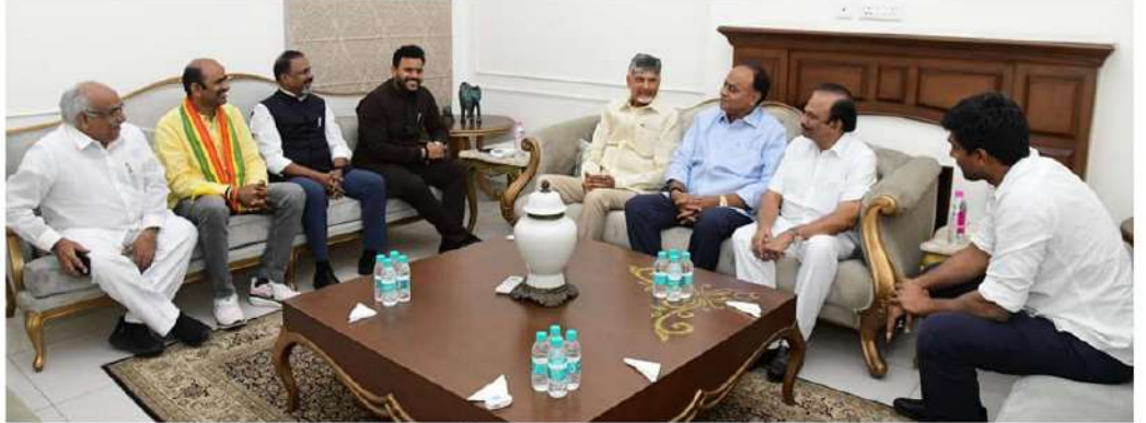
రాష్ట్రానికి చెందిన టీడీపీ ఎంపీలతో ఢిల్లీలో సమావేశమైన సీఎం చంద్రబాబు

ఆనంతరం ఏర్పాటు చేసిన విలేజ్ కడ సమావేశంలో ఎంపీ శ్రీకృష్ణదేవరాయలు ఈ అంశాలను వివరించారు. వ్యవసాయంపై ఆధారపడిన ఏపీలో గోదావరి - పెన్నా అనుసంధాన ప్రాజెక్ట్ ముఖ్యమైనదన్నారు. ఈ ప్రాజెక్టుకు సహాయ సహకారాలు అందించాలని కేంద్రాన్ని కోరామన్నారు. నదుల అనుసంధానానికి అవసరమైన నిధులను విడుదల చేయాలిందిగా విజ్ఞప్తి చేశామన్నారు. నదుల అనుసంధానంతో వ్యవసాయాధారిత ఆంధ్రప్రదేశ్ లోని ఖైదు వీడితే ప్రకాశం, రాయలసీమ ప్రాంతాలకు