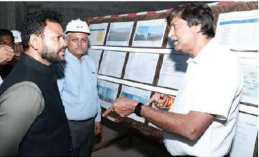
- ఎయిర్పోర్టు నిర్మాణంపై రాష్ట్రవ్యాప్త నాయుడు హామీ

పనులను ఆదివారం ఆయన పరిశీలించారు. విమానాశ్రయ సేవలు త్వరలోనే అందుబాటులోకి తీసుకురావాలనే ఉద్దేశంతో కేంద్ర మంత్రి ప్రతి నెలా నిర్మాణ పనులను క్షేత్రస్థాయిలో పరిశీలిస్తున్నారు. భోగాపురం విమానాశ్రయం ఆంధ్రప్రదేశ్ రాష్ట్రానికి కాకుండా జాతీయస్థాయి ప్రమోటలలో పూర్తి చేయాలనేది ప్రభుత్వ లక్ష్యమని తెలిపారు. దానికి అనుగుణంగా భవిష్యత్లో కార్యక్రమాలు చేపడతామని అమరావతి నాయకులు తెలిపారు. విమానాశ్రయం ఏర్పాటు చేసిన ప్రాంతాల్లో స్థానికంగా ఉద్యోగ అవకాశాలు, ఆర్థిక పరిస్థితులు పెరిగాయని, టూరిజం పెరిగిందని, చిన్న చిన్న వ్యాపారాలు వృద్ధి చెందాయని తెలిపారు. వీటన్నింటినీ దృష్టిలో పెట్టుకొని విమానాశ్రయాన్ని తొందరగా పూర్తి చేస్తే ఆస్తులు విజయనగరం, శ్రీకాకుళం, విశాఖపట్నం జిల్లాలు అభివృద్ధి చెందుతాయని తెలిపారు.