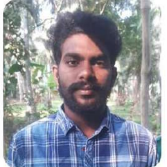
లోకేష్ చొరవ వల్లే అదిగి రాగలిగాను

వంట పనికోసమని చెప్పి ఏజంట్ ద్వారా కువైట్ వెళ్ళాను. తీసుకెళ్లబుకు నెలకు రూ.52వేల జీతం అని చెప్పారు. అక్కడకు వెళ్ళాక మోస్ మెయిదీ పని ఆహ్వానించారు. నేను మోసపోయానని అర్థమైంది. రోజుకు 20గంటలకు పైగా పనిచేయించారు. నెలరోజులు గడిచాక 22వేలు మాత్రమే ఇచ్చారు. మోసపోయిన విషయాన్ని నా భర్తకు తెలియజేశాను. కొందరి, లాన్లు తుద్రం చేయడంతోపాటు ప్రతిరోజూ 13 బాతులు లు కడిగించారు. విరామం లేకుండా పనిచేయడంతో ఏడవ వేలు సరం చెబుతుంది.