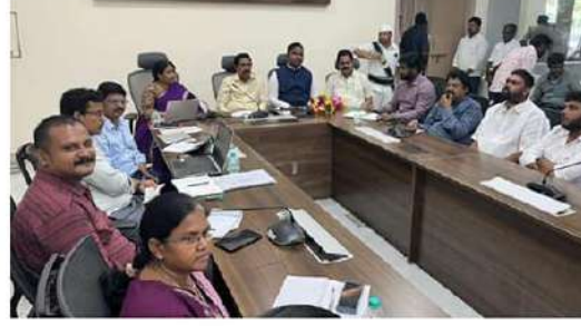
- మంత్రి నారాయణ వెల్లడి

నిల్లూరు కార్పొరేషన్ కార్యాలయంలో ఆధికారులు, బిల్డర్స్ అసోసియేషన్ ప్రతినిధులతో మంత్రి సమావేశం నిర్వహించారు. వివిధ శాఖల సర్పంచులను అనుసంధానం చేసి, నూతన విధానాన్ని డిసెంబర్ నుంచి అందుబాటులోకి తీసుకొస్తామని వెల్లడించారు. 2014-19లో భవన నిర్మాణ అనుమతులకు అనేక సంవత్సరాలు తీసుకొన్నారు. వైకాపా ప్రభుత్వం దానిని నివ్వడం చేసి, లాన్ స్టాంప్ విధానాన్ని అవినీతిమయం చేసింది. లాన్ స్టాంప్ అప్రూవల్ సిస్టంపై అభ్యయనం చేసి, నూతన సంస్కరణలకు శ్రీకారం చుడుతున్నామన్నారు. మున్సిపల్ శాఖ సర్పంచులతో అన్ని శాఖల సర్పంచుల అనుసంధానం చేసి, వెబ్సైట్ ద్వారానే అనుమతులు వచ్చేలా చర్యలు తీసుకుంటామని మంత్రి నారాయణ వెల్లడించారు.