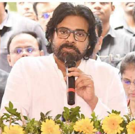
వైకే పోలీసులు మనల్ని బయ్యించడంలా అన్న ఆలోచనల నుంచి బయటకు రావాలన్నారు. పది మంది కలిసి వెళ్లి పిచ్చాడు చేస్తే అలాంటి పరిస్థితులును నిలువరించవచ్చన్నారు. గంజాయి, డ్రగ్స్ నిర్మూలనకు ప్రత్యేక కార్యచరణ

కూటమి ప్రభుత్వం అలాంటి ప్రభుత్వం కాదు. వైసీపీ వారు ఇంట్లో కూర్చుని రోడ్డు మీద ఆడ బిడ్డలకు నంద్రక్షణ లేదని విమర్శలు చేస్తున్నారు. ఆడ బిడ్డల మీద దాడులు ఎప్పుడు మొదలుపెట్టారు? అని ప్రశ్నించారు. రాష్ట్రంలో ఎన్నడూ లేని విధంగా ఉన్నాయిలు ఎందుకు ఇలా పెట్టిపోతున్నారు అర్థం కావడం లేదన్నారు. గత ప్రభుత్వంలో పాలకులు బాధ్యతాయోజనంగా నోటి వచ్చినట్లు మాట్లాడేవారు. నాటి ప్రతిపక్ష నేత, ప్రస్తుత ముఖ్యమంత్రి చంద్రబాబు నాయుడి సతీమణిని తిట్టారన్నారు. ఇక్కడికి వచ్చి బిడ్డలను రేపే చేస్తామని మాట్లాడారన్నారు. పాలించే నాయకులే ఇష్టానుసారంగా మాట్లాడి క్రిమినల్ కేసులు చేసినా పన్ను లేదన్న వైద్యం వస్తుందన్నారు. సామాజిక మాన్యువల్ అడ బిడ్డలపై అభిమాని అవుతారన్నారు. మొదట మనదరిలో సామాజిక స్పృహ ఉండాలన్నారు. అన్యాయం జరిగితే ఆపాలన్న ఆలోచన రావాలన్నారు. కళ్ల ముందు ఆడబిడ్డలను ఏదివిస్తుంటే చోద్యం చూస్తూ ఉండడం విచార కరమన్నారు. ముందుగా ప్రజలు కళ్ల ముందు జరుగుతున్న అన్యాయాన్ని నిలువరించాలి. తన కళ్ల ముందు ఏ ఆడబిడ్డల బయ్యింది కలిగినా మాస్తూ ఊరుకోవద్దు. పోలీసులు కూడా ఫిర్యాదు చేసిన వారిని క్రిమినల్ గా పరిగణించే కుడదన్నారు. జాతీయ కాశీవాడ జిల్లాలో జరిగిన రోడ్డు ప్రమాదానికి సంబంధించి కేసు పెట్టడానికి వైకే అధికారులు తగిన రీతిలో స్పందించలేదన్నారు. ఆ కేసులో తమ బిడ్డ బ్రెయిన్ డెడ్ అయితే ఆతని తల్లి అవయాలు దానం చేయడం కనీసం కదిపించిందన్నారు. ఇలాంటి సమయంలో ప్రాణాలు తీసుకురాకపోయినా, మన ప్రవర్తన ద్వారా ఒకప్పుడు నిర్వహించారు. ప్రజలు కూడా నేరం మీద ఫిర్యాదు చేసేందుకు