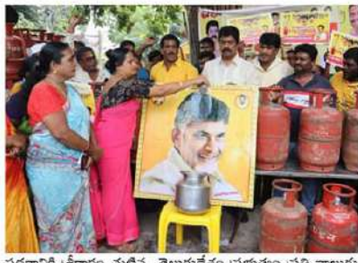
పథకానికి శ్రీకారం చుట్టిన తెలుగుదేశం ప్రభుత్వం ప్రతి నాలుగు నెలలకు ఒకటి కొవ్వన ఏడాదికి 3సిలిండర్లు ఉచితంగా అందించనున్నదని అన్నారు. తెలుగుదేశం పార్టీ రాష్ట్రంలో ఎప్పుడు అధికారంలోకి వచ్చిన సందర్భంగా ఉండిన ముందు రాష్ట్రంలోని మహిళలేనని, మహిళల కోసం తెలుగుదేశం ప్రభుత్వం అనేక పథకాలను, అనేక సంక్షేమ కార్యకలాపాలను నిర్వహిస్తున్నారన్నారు. 1995లో ముఖ్యమంత్రిగా నానా చంద్రబాబునాయుడు రాష్ట్రంలోని మహిళలకు ద్వైతా సంఘాలను ఏర్పాటు చేశారని తెలపారు. దీనివల్ల సంక్షేమంగా జెడు మీద మంచి గెలిచిన పండుగను ప్రతి ఒక్కరు ఆనందంగా జరుపుకోవాలని గ్యాస్ సిలిండర్ బుక్ చేసిన ప్రతి మహిళకు వారి ఇంటికి ఉచితంగా తీసుకొని వచ్చే కార్యక్రమాన్ని నేటి నుండి మొదలు పెడుతున్నామని అన్నారు. ఈ కార్యక్రమంలో డివిజన్ అధ్యక్షులు బోనీ నాని, ఎరుబాలో కనకారావు, దేవర సత్యనారాయణ, రాజు, ఎన్.కె. ఖట్టే, మచ్చ ఇమాన్వెల్, సోదరి ఈశ్వరి, రాజీ, శృతి, అబ్బాయమ్మ, అప్పుల సూరమ్మ తదితరులు పాల్గొన్నారు.

విజయవాడ (వైతన్యరథం): అర్బులైన వారందరికీ దీపావళి పండుగను పురస్కరించుకుని మూడు ఉచిత గ్యాస్ సిలిండర్లు ప్రభుత్వం పంపిణీ చేస్తుందని డి.పి.పి ఎమ్మెల్యే ఖానా ఉమామహేశ్వరరావు వ్యాఖ్యానించారు. నాడు కట్టల పాయింట్ కష్టాలు తప్పించేందుకు దీపం పథకాన్ని ప్రవేశపెట్టిన చంద్రబాబునాయుడు... నేడు మరోసారి పేదల జీవితాల్లో వెలుగులు నింపేందుకు దీపం పథకం 2.0ను ప్రవేశపెట్టారని అందులో భాగంగా అర్బులైన ప్రతి కుటుంబానికి ఏడాదికి మూడు గ్యాస్ సిలిండర్లు పంపిణీ చేయనుండవచ్చు. రాష్ట్ర ఆర్థిక పరిస్థితి సహకరించకపోయినా ఇప్పటి మాట ప్రకారం ముఖ్యమంత్రి నారా చంద్రబాబునాయుడు దీపావళి కానుకగా మూడు ఉచిత గ్యాస్ సిలిండర్ల పథకాన్ని అమలు చేస్తున్నారని ఖానా ఉమా వ్యాఖ్యానించారు. బుధవారం విజయవాడ నగరంలోని 57వ డివిజన్ న్యూ రాజరాజేశ్వరి పేటలో దీపం పథకం ప్రారంభోత్సవ కార్యక్రమంలో మహిళలకు గ్యాస్ సిలిండర్లు పంపిణీ కార్యక్రమం ఘనంగా నిర్వహించారు. మొదటిగా ముఖ్యమంత్రి నారా చంద్రబాబునాయుడి చిత్రపటానికి పాలాభిషేకం నిర్వహించారు. ఆనంతరం ఆయన మాట్లాడుతూ... ఉచిత గ్యాస్ సిలిండర్లు