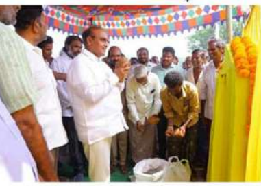
చిలకలూరిపేట (చైతన్యరథం): జగన్మోహన్ రెడ్డి తప్ప అందరూ రాష్ట్రంలో జరుగుతున్న అభివృద్ధి గురించే మాట్లాడుకుంటున్నారని మాజీమంత్రి, చిలకలూరిపేట తెలుగుదేశం పార్టీ ఎమ్మెల్యే