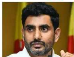
జాషువా అన్నారు. గుర్రం జాషువా తీవ్ర ప్రజల నాలుకల యందు. అంటూ మంత్రి లోకేష్ పోస్టు చేశారు.

అమరావతి(చైతన్యరథం): అక్షరాన్ని ఆయుధంగా చేసుకుని మూఢాచారాల పై తిరగడదిన కవి గుర్రం జాషువా అని రాష్ట్ర విద్య, బాలికాశాల మంత్రి నారా లోకేష్ కొనియాడారు. జాషువా జయంతి జయంతి సందర్భంగా తన వారం ఎక్స్ వేదికగా ఆయనకు మంత్రి లోకేష్ నివాళులర్పించారు. ఆయన పద్యాలకు జరిగిన అన్యాయాలపై సాహిత్య ఉద్యమం ఆదర్శించిన నవయుగ కవి చక్రవర్తి గుర్రం