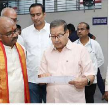
తిరుమలలో శుక్రవారం రంగినీ చరిత్రలు నిర్వహించిన తితిదే రూపొందించిన వ్యాఖ్యలు

పేర్కొంది. తిరుమల కొండ నమూనాపట్టణానికి చాలా ఎత్తులో ఉండటం కారణంగా అక్కడ అపాయనం తప్పక ఉంటుంది. కాలి నడకన రావడం చాలా ఒత్తిడితో కూడుకున్న విషయం కాబట్టి గుండె సంబంధిత వ్యాధులు, ఉబ్బనవ్యాధిని తీవ్రతరం చేసే అవకాశముంది. భక్తులు తరచుగా తగిన జాగ్రత్తలు తీసుకోవాలని తితిదే సూచించింది. దీర్ఘకాలిక వ్యాధులతో బాధపడుతున్న భక్తులు వారి రోజువారీ మందులు వెంట తెచ్చుకోవాలని, కాలి నడకన వచ్చే భక్తులకు ఎమెరా సమస్యలు ఎదురైతే అతిపెద్ద కారిబాట మార్గం లోని 1500 మెట్లు, గారి గోపురం, భాస్కరాజ్ సన్నిధి వద్ద వైద్య సహాయం పొందవచ్చని సూచించింది.