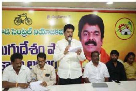
మహానాడంలో జరుగుతోవడం ఆనవాలుగా వస్తుందని, అందులో భాగంగా ఈ ఏడాది సభ్యత్వ నమోదు కార్యక్రమానికి శ్రీకారం చుట్టడం జరిగిందన్నారు. తనవారం ఉదయం ముఖ్యమంత్రి వారా చంద్రబాబునాయుడు మొదటి రెన్యూవల్ సభ్యత్వాన్ని నమోదు

విజయవాడ (వైతన్యరథం): టీడీపీ సభ్యత్వం కలిగి ఉండటం ప్రజలు గౌరవంగా భావిస్తున్నారని విజయవాడ సెంట్రల్ నియోజకవర్గ టీడీపీ ఎమ్మెల్యే బొండా ఉమా మహామహోత్సవం వ్యాఖ్యానించారు. నియోజకవర్గం వ్యాప్తంగా 75 వేలకు పైగా సభ్యత్వాల నమోదు చేయాలని విలువునిచ్చారు. నియోజకవర్గంలోని 21 డివిజన్ లో వాడవాడలా టీడీపీ సభ్యత్వ నమోదు కార్యక్రమాలు చేపట్టాలని సూచించారు. కుకరవారి బొండా ఉమా మహోత్సవం ఆధ్వర్యంలో సభ్యత్వ నమోదు కార్యక్రమంపై సన్మాహాళిక నమోదేశాన్ని నిర్వహించారు. ఈ సందర్భంగా బొండా ఉమా మాట్లాడుతూ... 1982వ సంవత్సరంలో వెలకొచ్చిన టీడీపీ నేతరి పెద్దపట్టు ప్రజల మన్ననలు పొందుతుండడం క్రమశిక్షణ కలిగిన కార్యకర్తలు ఉండటంతోనే సాధ్యమైందని అన్నారు. ప్రతి రెండు సంవత్సరాలకు ఒకసారి పార్టీ సభ్యత్వ నమోదు కార్యక్రమం ప్రతి ఏడాది పార్టీ