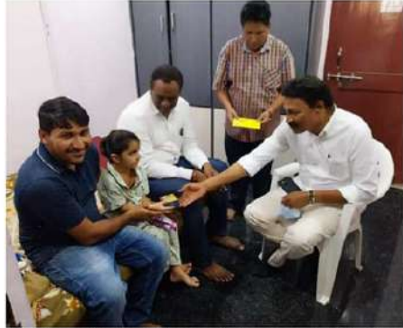
తీవ్రమైన అనారోగ్యానికి గురైంది చెప్పారు. ఆ బాలిక శరీరం సబ్బాగా మారినట్లు కళ్ళు తిరిగి కింద పడిపోయిందని, మరణానికి చేరువైన సమయంలో తన కార్యాలయానికి వచ్చారని చెప్పారు. ఆ సమయంలో

విజయవాడ (చైతన్యరథం): ముఖ్యమంత్రి నారా చంద్రబాబునాయుడు ముఖ్యమంత్రి సహాయ నిధికి సరైన అర్థం చెప్పాడని కూర్చు నియోజకవర్గ ఎమ్మెల్యే గద్దె రామమోహన్ అన్నారు. చైద్య సేవల కోసం పేదల ఆవులు పాలు కాకూడదనే ఉద్దేశ్యంతో వారికి సీఎంఆర్ఎఫ్ ద్వారా వైద్య ఖర్చులను అందజేస్తూ వారికి ముఖ్యమంత్రి నారా చంద్రబాబునాయుడు అండగా నిలుస్తున్నారని చెప్పారు. కూర్చు నియోజకవర్గ పరిధిలోని 11వ డివిజన్లో ముఖ్యమంత్రి సహాయ నిధి ద్వారా మంజూరైన రూ.6లక్షలతో వైద్యం చేయించుకుని ఇంటికి వచ్చిన బాలిక జియూసు శుక్రవారం నాడు ఎమ్మెల్యే గద్దె రామమోహన్ వారి ఇంటికి వెళ్ళి పరామర్శించారు. అనంతరం మండులు నిమిత్తం గద్దె రామమోహన్ సొంత నిధులను సుంచి రూ.25 వేలు అద్దక సహాయాన్ని అందజేశారు. ఈ సందర్భంగా ఎమ్మెల్యే గద్దె రామమోహన్ మాట్లాడుతూ, ముఖ్యమంత్రి సహాయ నిధికి సరైన అర్థం చెప్పింది ముఖ్యమంత్రి నారా చంద్రబాబునాయుడు అని అన్నారు. ఆరోగ్యకే వచ్చినా కూడా ముఖ్యమంత్రి సహాయ నిధి ద్వారా పేదలకు వైద్య ఖర్చులను అందజేస్తున్నారని చెప్పారు. రాజస్థాన్ నుంచి వచ్చిన రింక్ కుమార్తె ఐదు సంవత్సరాల బాలిక జియూసు గుండెకు రంధ్రం పడి