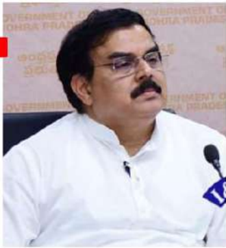
సిరిందర్లను డెలివరీ చేస్తామని, ఇందుకై మూడు రోజుల ముందునుంచే సిరిందర్ల బుకింగ్ ప్రక్రియ ప్రారంభించేందుకు మంత్రి మండలి ఆమోదం తెలిపిందన్నారు. పథకం అమలుకు ఏటా రూ. 2,684 కోట్లమేర ఖర్చవుతుందన్నారు. సిరిందర్ల పథకం