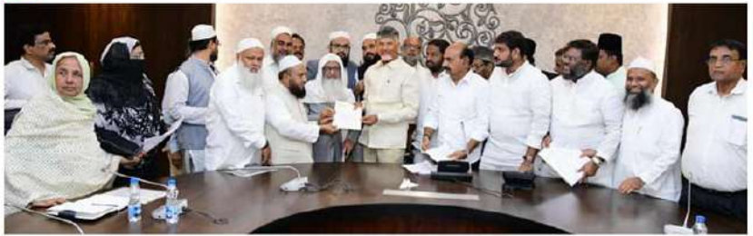
పార్లమెంట్లో చట్టాన్ని వ్యతిరేకించాలని కోరుతూ ముఖ్యమంత్రికి వినతిపత్రం సమర్పించారు. దీనిపై చర్చించి తగు నిర్ణయం తీసుకుంటామని ముఖ్యమంత్రి ముస్లిం ప్రతినిధులకు తెలిపారు.

కలిశారు. వక్స్ యాక్ట్ సవరణపై కేంద్రం చేసిన ప్రతిపాదనలపై తమ అభ్యంతరాలు తెలిపారు. కేంద్రం తీసుకొచ్చిన ప్రతిపాదన వల్ల వక్స్ బోర్డు నిర్వీర్యమవుతుందని... ఈ చర్య ముస్లింవర్గ హక్కులు, ముస్లింబాలన దెబ్బతీస్తుందని వివరించారు. ఈ సందర్భంగా ఆయా సంఘాల ప్రతినిధులు తమ అభ్యంతరాలను, ఆందోళనను వివరించారు. వక్స్ చట్టంలో మార్పులను అంగీకరించవద్దని,