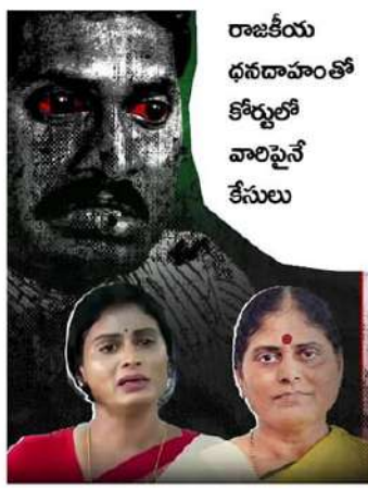
రాజకీయ ధనదాహంతో కోర్టులో వారిపైనే కేసులు