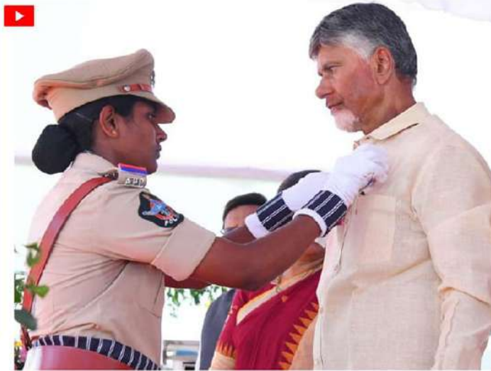
బాధ్యతగా.. వ్యవస్థ పటిష్టత కల్పిస్తూగా భావిస్తున్నట్లు సీఎం చంద్రబాబు ప్రకటించారు.