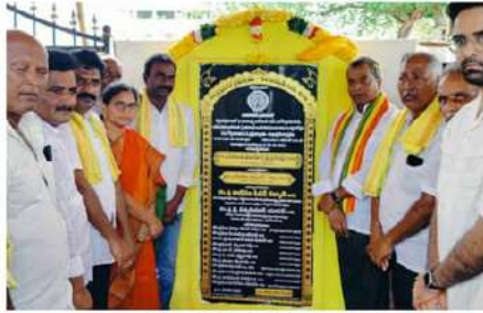
విజయవాడ రూరల్ మండలంలో రహదారుల నిర్మాణానికి భూమిపూజ