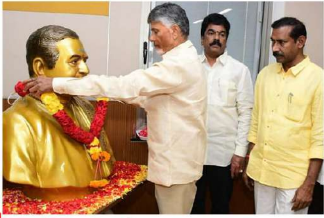
ప్రధాని మోదీ పట్టణం, కృషి అందరికీ ఆదర్శనీయం

ప్రజల సమూహాన్ని చూరగన్న రాజకీయ పార్టీలే పదికాలాలు పరిధివల్లకాయి. కూటమిగా ఏర్పడిన ప్రభుత్వం సంఘటిత శక్తిగా మంచిపనులు తలపెడితేనే.. ప్రజా సమూహాన్ని నిలబెట్టుకోగలుగుతాం. ప్రతి ఒక్కరూ క్రమశిక్షణతో ఉండాలి. ప్రభుత్వంలో చివరి ఉద్యోగి తప్ప చేసినా బాధ్యత సీనియర్ అవుతుంది. ఎన్టీయేలో ఏ కార్యకర్త తప్ప చేసినా సీనియర్ వేరెత్తి చూపిస్తారు. మీరు మంచి చేసినా, తప్పు చేసినా పార్టీ, ప్రభుత్వానికి పర్తిస్థాయి. అందుకే -అందరికీ ఒకటి చెప్తాం: మనం ప్రవర్తించే విధానంపైనే మనకు వచ్చే వెజాంటిటీల ఆధారపడి ఉంటాయి. గత ఐదేళ్లలో ఆరిగిన విభ్రాంత వాస్తవం ప్రజలకు చెప్పాలని ఏడు శ్లోకపత్రాలు విడుదల చేశాం. అమరావతి, పోలవరం, విద్యుత్, మద్యం, ల్యాండ్ హాఫీయా, లా అండ్ ఆర్డర్, ఆర్థిక వ్యవస్థపై ప్రజలకు రాష్ట్ర పరిస్థితి వివరించాం. గత ప్రభుత్వంలో మద్యం, బాకర, గంజులు ఇష్టాధీనం దోచేశారు. గంజాయి రాష్ట్రంగా మార్చేశారు. ఎన్నో అత్యాచారాలకు గంజాయి మత్తే కారణం. రూ.10 లక్షల కోట్లకు పైగా అప్పులు చేశారు. యేటా రూ.90 వేల కోట్ల వడ్డీ కట్టారు. క్షేత్రపరిస్థితిలో పడిన రాష్ట్రం భవిష్యత్ బాగుండాలంటే ఎన్టీయే ఉండాలని ప్రజలు విశ్వసించారు. మనపై నమ్మకం, పవనీపట్ల విశ్వాసం, ఇతోధిక సాయంతో రాష్ట్రాన్ని తేలద్రం అడుకుంటున్న ఆశతోనే కూటమిని ప్రజలు గెలిపించారు. ప్రజల సమూహాన్ని నిలబెట్టాలని గడుతర బాధ్యత మనపై ఉంది. - ముఖ్యమంత్రి చంద్రబాబు నాయుడు