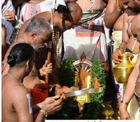
తిరుమల పుష్కరిణిలో శ్రీవారి చక్రస్థానం