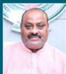
ప్రతి ఒక్కరిలో సాధారణ రంగాల