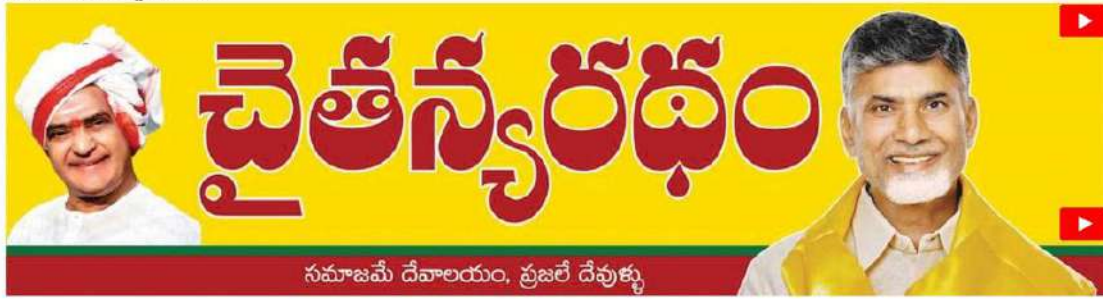
సమాజమే దేవాలయం, ప్రజలే దేవుళ్ళు