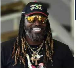
ఐపీఎల్లో అత్యధిక సిక్స్లు, అత్యధిక ఛక్రీకర స్కోరు సాధించిన అటగాడి క్రిస్ గేల్ సెలిట రికార్డు ఇప్పటికీ కొనసాగుతోంది. 2013లో పుణె చారియర్లపై క్రిస్ గేల్ 175 పరుగులు విద్యంసకర ఇన్వింగ్స్ అచాడు. టీగ్లో ఓపెనర్గా 357 సిక్స్లు బాచాడు.

గురించి చెప్పాలంటే.. అతను ఇంకా పుట్టాడా? లేదా అతికే ఉన్నాడా? అని నాకు తెలియదు. నా దృష్టిలో ప్రతి బొల్లర్ సవాలే. వికెట్ తీయడానికి ప్రయత్నిస్తుంటారు” “ప్రతి బొల్లర్ ఓ మంచి బంతితో టాపెలోకి వెళ్లిచ్చు, అయితే అదే సమయంలో టాప్ ఛాన్స్ ఫాస్ట్ బొల్లర్లు, స్పిన్లను ఎదుర్కోవడం సరదాగా ఉంటుంది. ప్రతి బొల్లర్ మంచి సవాల్లైనవాళ్లే. కానీ ఈ యూనివర్సల్ బాస్ వాళ్ల కంటే మరింత సవాల్లైనవాడు. ఇక ఐపీఎల్లో పాల్గొనడం ఎంతో బాగుంటుంది. నా దగ్గర అపారమైన అనుభవం ఉంది. అంతేగాక ప్రత్యేకమైన అనిభవం చెలాయించాడు. నా అనుభవాన్ని తంతుకోవటాన్ని నేను ఆస్వాదిస్తాను” అని క్రిస్ గేల్ సెల్లొన్నాడు.