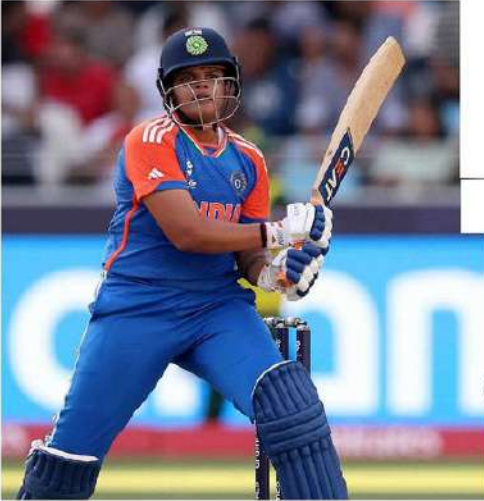
మహిళల టీ20 ప్రపంచకప్ 2024లో టీమిండియా బోజీ క్రాస్టింది. దాయాదీ పాకిస్థాన్తో ఆదివారం ఆదిగిన రెండో రిగ్ మ్యూచోల్ హార్వన్ ప్రీట్ కార్ సారథ్యంలోని భారత్. 6 వికెట్లు తీచాతో గెలుపొందింది. ముందుగా బొలింగ్లో సల్లా దాది పాక్ను స్వల్ప స్కోర్కు పరిమితం చేసిన హర్వన్ సేన.. ఆ తర్వాత షిట్ తగ్గట్లు బ్యాటింగ్ చేసి విజయాస్తుంది.

జట్టు నిర్ణీత 20 ఓవర్లలో 8 వికెట్లకు 105 పరుగులే చేసింది. నిదా దార్(34 బంతుల్లో ఛోరోతో 28) టాప్ స్కోర్లుగా నిలవగా మిగతా బ్యాట్లల్లు దారుణంగా విఫలమయ్యారు. భారత బొల్లల్లో తెలుగు తేజం అరుంధతి రెడ్డి(3/19) మూడు వికెట్లతో సల్లా దాటగా.. రేణుక సింగ్, దీప్తి చర్చ తలో వికెట్ తీసారు. క్రేయాంక పాటిల్కు రెండు వికెట్లు దక్కాయి. అనంతరం లక్ష్మచేదనకు దిగిన భారత్ 18.5 ఓవర్లలో 4 వికెట్లకు 108 పరుగులు చేసి విజయాన్ని అందుకుంది. స్ట్రోక్ ఓపెనర్ స్మృతి మంధాస(7) విఫలమైనా.. షెఫాలీ వర్మ(35 బంతుల్లో 3 ఛోర్లతో 32), జెమీమా రోడ్రిగ్స్(28 బంతుల్లో 23), హర్వన్ ప్రీట్ కార్(24 బంతుల్లో ఛోరోతో 29) అచితాచి అడి భారత విజయంలో కీలక పాత్ర పోషించారు. హర్వన్ ప్రీట్ కార్ గాయంతో రిజైర్వ్ హోగ్గా వెనుదిరగ్గా.. రిచా ఫోఫ్(0) గోల్డెన్ డకౌట్ అయింది. క్రీజలోకి వచ్చిన దీప్తి చర్చ(7 నాటౌట్), సజీవన్ సజన(4 నాటౌట్) ఎలాంటి టెస్టులం చేయకుండా విజయ లాంఛనాన్ని పూర్తి చేశారు. పాకిస్థాన్ బొల్లల్లో ఫతిమా సనా(2/23) రెండు వికెట్లు తీయగా.. సదియా అబ్బాస్, ఓమ్రూ సాహెల్ తలో వికెట్ తీసారు. బొలింగ్లో మూడు వికెట్లతో సల్లా దాదీన తెలుగు రేజం అరుంధతి రెడ్డికి మ్యూచ్ ఆన్ ది మ్యూచ్ అవార్డ్ దక్కింది.