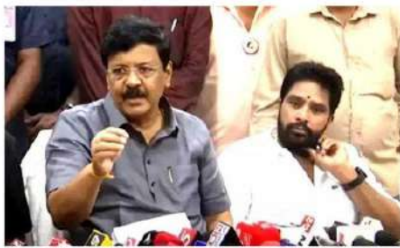
పర్యాటక రంగానికి పెద్దపీట.. పరిశ్రమ హెబాదా

కూలమి ప్రభుత్వం ఆధికారంలోకి వచ్చినప్పటి నుండి జన్మదీపరకు పర్యాటక రంగ అభివృద్ధిపై దృష్టి పెట్టింది. ముఖ్యమంత్రి చంద్రబాబు నాయుడు నిర్వహించిన పర్యాటక శాఖ సమీక్షా సమావేశంలో సైతం రాష్ట్రంలో పర్యాటక రంగానికి పెద్దపీట వేయాలని సూచించారు. పర్యాటక రంగానికి పటిష్టమైన హెబాదా కర్పించడం శుభపరిణామమని పేర్కొన్నారు. పర్యాటకలకు అకర్పించాలన్న ఉద్దేశంతో హాస్పిటాలిటీ, హెబాటల్ యాజమాన్యాల కోరిక మేరకు రాష్ట్ర వేళలో 11, 12 గంటల వరకు హెబాటల్ కార్యకలాపాలు నిర్వహించుకునేలా ప్రభుత్వం సూత్రప్రాయం అంగీకారం తెలిపింది.