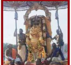
శ్రీవారి వాహన వైభోగం