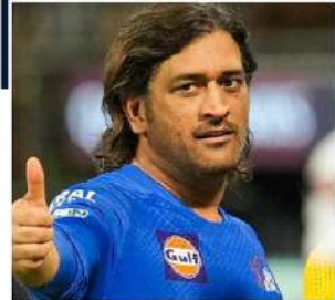
భారత్ క్రీకెట్ చరిత్రలో అత్యంత విజయవంతమైన కెప్టెన్ మహేంద్ర సింగ్ ధోనీ అని వెస్టిండీస్ దిగ్గజ క్రీకెటర్ క్రిస్ గేల్ అన్నాడు. విలార కోహ్లా, రోహిత్ శర్మకు కూడా సారకు లుగా టీమిండియాకు గొప్పగానే బాధ్యతలు నిర్వహించారు, కానీ ధోనీనే అత్యుత్తమ కెప్టెన్ అని యూనివర్సల్ బాస్ గేల్ తెలిపాడు. ఓ

టిమిండియా మాజీ క్రీకెటర్ సురేశ్ రైనా విద్యంసకర బ్యాటింగ్తో చెలరేగాడు. అమెరికా వేదికగా జరుగుతున్న నెషనల్ క్రీకెట్ రిగ్లో న్యూయార్క్ లయన్స్కు ప్రాసింగ్లం మూస్తున్న సురేశ్ రైనా.. లాన్ ఏంజెల్స్ వేస్టో జరిగిన మ్యూచ్లో విద్యంసకర హోర్లె సెంబరతో సల్లా చాటాడు. లాన్ ఏంజెల్స్ కెప్టెన్, బంగ్లాదేశ్ ఆల్ రౌండ్ షజీబ్ అల్ హసన్ను సురేశ్ రైనా చెడుగులు అచాడు. అంతర్జాతీయ క్రీకెట్కు దూరమైనా.. భారీ షాట్లు అడి సల్లా తనలో ఇంకా ఉందని రైనా దాది చెప్పాడు. షజీబ్ అల్ హసన్ బొలింగ్లో సురేశ్ రైనా రెండు భారీ సిక్స్లతో పాటు ఒక ఛోరో క్రోడ్ 18 పరుగులు విండుకున్నాడు. సురేశ్ రైనా భారీ షాట్లతో విరుచుకుపడటంతో షజీబ్ అల్ హసన్ మట్టి బొలింగ్ చేయలేదు. ఇక రైనా విద్యంసకర బ్యాటింగ్కు అతని ప్యాన్స్, సిఎస్ఆర్ అభిమానులు ఖిదా అవుతున్నారు. ప్రస్తుతం ఇండుకు సంబంధించిన వీడియో వెల్లింబు వైరల్గా మారింది. దూకుడైన బ్యాటింగ్లో సురేశ్ రైనా 28 బంతుల్లో 53 పరుగులు చేశాడు. ఇండులో మూడు సిక్స్లతో 4 ఛోర్లు ఉన్నాయి. దాంతో లయన్స్ జట్టు నిర్ణీత 10 ఓవర్లలో 126 పరుగులు చేసింది. ఈ టోర్న్ 60 జాల్ ఫార్మాట్లో జరుగుతోంది. సురేశ్ రైనాకు అంధంగా.. శ్రీలంక బ్యాటర్ ఉషల్ తరంగా(23 బంతుల్లో 40) రాజించాడు. అనంతరం వేమ్స్ నిర్ణీత 10 ఓవర్లలో 7 వికెట్లు 107 పరుగులే చేసి ఓటమిపాలైంది. టీమ్ డేవిడ్ పోరాడినా ఫలితం లేకపోయింది. షజీబ్ అల్ హసన్(13) కూడా విఫలమయ్యాడు.