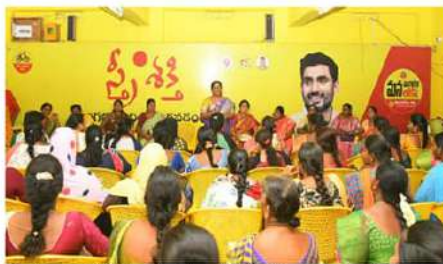
మంత్రి నారా లోకేశ్ కుటుంబిషుడు పంపిణీ చేశారు. నారా లోకేశ్ కుటుంబిషుడు పంపిణీ చేశారు. నారా లోకేశ్ కుటుంబిషుడు పంపిణీ చేశారు.