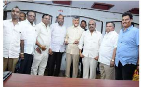
గాంధీ ఫౌండేషన్ అర్జన్ బ్యాంక్ లిమిటెడ్ విజయవాడ రూ.10 లక్షలు