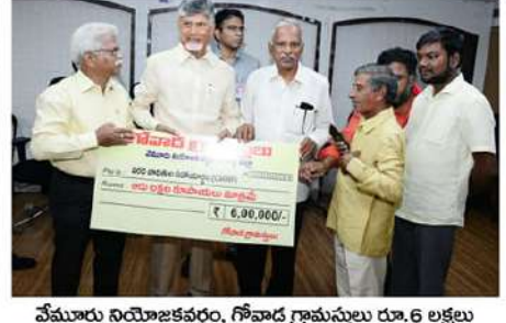
వేమూరు నయోజకవర్గం, గోవాడ గ్రామస్థులు రూ.6 లక్షలు