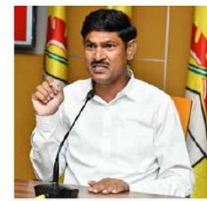
తెలివితక్కువతనానికి నిద్రాసమని ఆగ్రహం వ్యక్తం చేశారు. వరదలు వచ్చినప్పుడు భూమిని కాకుండా ఆహారంలో ఎంతవరకు సర్ది చేసే జగన్ నేడు విధిలేని పరిస్థితుల్లో వరద ముప్పు ప్రాంతాల్లో పర్యటించారని ఎద్దేవా చేశారు. వరద బాధితులను ఏదిగద్దాలా ఆదుకోవాలి చంద్రబాబును తెలుసునని ప్రభుత్వంపై ఎన్ని విమర్శలు చేసినా ప్రయోజనం ఉండదన్నారు. వరద వేళ రాజకీయాలు చేయడం తగిన కనీసం ఉదాహరణ సమయంలోనేనా మానవత్వంతో ఉంటారా మనుకుంటున్నామని ఎం. ధారు నాయక్ హితవు పలికారు.

మరో లక్ష మందికి ఆహారం అందజేస్తున్నారని అన్నారు. వరద నీటిలో చిక్కుకున్న బాధితులు ఎవరూ భయపడాలివ్వన పని లేదని, అందరినీ అదుకుంటామని, అందరూ ధైర్యంగా ఉండాలని ముఖ్యమంత్రి చంద్రబాబు భరోసా ఇచ్చారని, విజయవాడలోనే ఉంటూ పగలూ, రాత్రి నిద్రించామంటూ సహాయక చర్యలను పర్యవేక్షిస్తున్నారని అన్నారు. గత ఐదేళ్లు బుడమేరును గాలికొదిలేసిన జగన్.. నేడు ప్రభుత్వంపై బుడమ వల్లెందుకు వచ్చాడని మండిపడ్డారు. విపత్తుల సమయంలో జగన్ ఏనాడు బాధితుల పక్షాన నిలబడలేదన్నారు. ఐదేళ్ల పదవీకాలంలో సాయంత్రం 5 తరువాత ఓపర్ లోబా కూడా జగన్ ఇంటికి రాలేదన్నారు. ప్రజలు ఇబ్బందుల్లో ఉన్నప్పుడు ప్రజాసహకార కార్యాలయాలని తెలిపారు. జగన్ రెడ్డి షేక్ ప్రచారం మానుకోవాలని... విమర్శలు నిర్మాణాత్మకంగా ఉండాలన్నారు. చంద్రబాబు ఇంటి కోసం బుడమేరు నీరు ధైర్యం చేశారని చెప్పడం జగన్