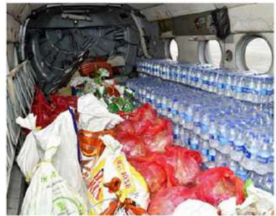
బంగాళాఖాతంలో ఏర్పడిన వాయుగుండం ప్రభావంతో కురిసిన భారీ వర్షాల వల్ల విజయవాడలో ముంపుకు గురైన పలు ప్రాంతాల్లోని వరద బాధితులకు హెలికాప్టర్ల ద్వారా ఆహారము, త్రాగునీరు, బస్కెట్లు, పాలు, వంటి సహకారాలను గన్నవరం అంతర్జాతీయ విమానాశ్రయంలో భారత వాయుసేవ ప్రత్యేక హెలికాప్టర్లలో పంపిణీకి సిద్ధం చేస్తున్న అధికారులు.