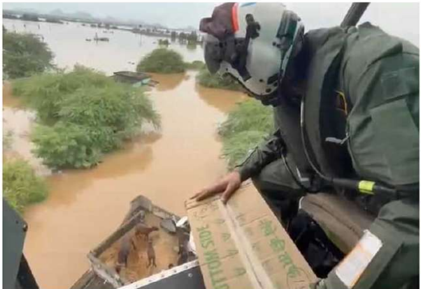
విజయవాడలోని వివిధ ప్రాంతాల్లోని వరద బాధితులకు విజయవాడ శ్రేణిలో సంస్థల వారు చేయమిన ఆహార పోటెలు, మంచినీటిని మంగళవారం ఉదయం నుంచి హెలికాప్టర్ల ద్వారా అందిస్తోన్న ఎన్సీఆర్ఎఫ్ బృందాలు.