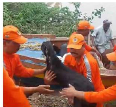
విజయవాడలోని ముంపు బాధితులకు సురక్షిత ప్రాంతాలకు తరలిస్తూ, ఎస్టీఆర్ఎస్, ఎస్టీఆర్ఎస్ బృందాలు, గుంటూరు జిల్లా అన్నవరపు లంక గ్రామం వద్ద వరదలో చిక్కకున్న గొర్రెలు, మేకలను రక్షించి సురక్షిత ప్రాంతాలకు తరలిస్తూ, ఎస్టీఆర్ఎస్ బృందాలు