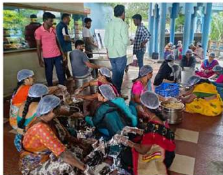
జిల్లాస్థాయి అధికారులనుండి త్రైతస్థాయి సిబ్బంది పరకు ప్రతి ఒక్కరూ భాగస్వామ్యం జరిగిందన్నారు.