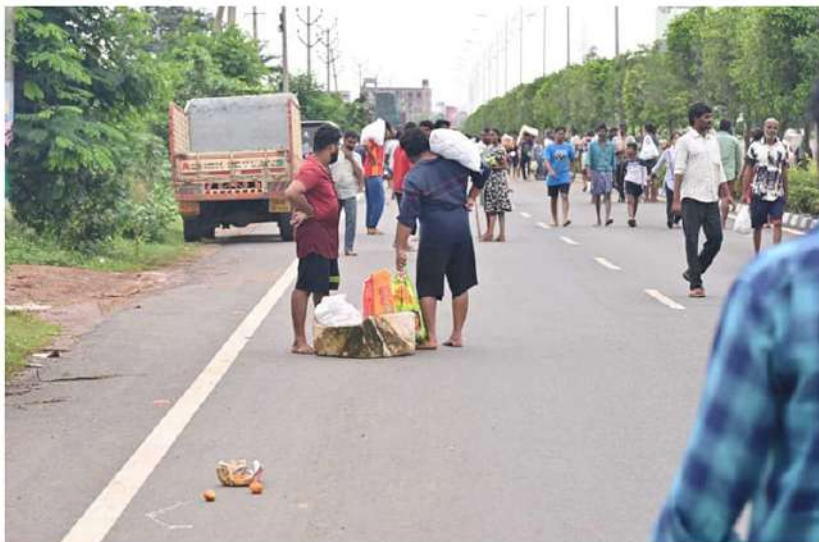
వరద బాధితులకు ప్రభుత్వ యంత్రాంగం నుంచి ఆహారం, మంచినీళ్లు అందడంతో ఆనందంగా తీసుకొన్న దృశ్యం