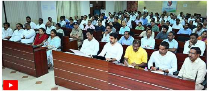
వరద సహాయక చర్యలపై వ్యూహం బిల్లు కలెక్టర్ కార్యాలయంలో మంగళవారం రాత్రి అధికారులు, మంత్రులతో ముఖ్యమంత్రి చంద్రబాబు నాయుడు నిర్వహించిన సమీక్ష