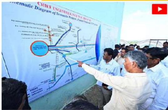
సోమశిల ప్రాజెక్టు స్థలం, సిద్దివేను క్షేత్రస్థాయిలో పరిశీలనకు ముఖ్యమంత్రి చంద్రబాబు. మాన్ పాయింట్‌గా ద్వారా ప్రాజెక్టు ఎంపికైన అధికారులనుంచి అడిగి తెలుసుకుంటున్న చంద్రబాబు