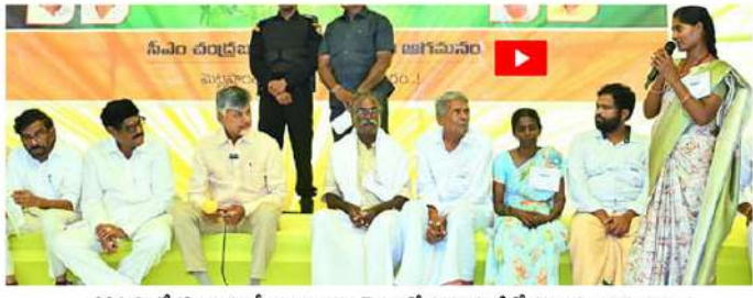
సోమశిల క్షేత్రస్థాయి పరిశీలన అనంతరం రైతులతో ముఖాముఖీ ముఖ్యమంత్రి చంద్రబాబు

తుడుచుకోమని చెప్పాడు. వివేకాను చంపి నారాసుర రక్తపత్రం అని మళ్ళీ నాపైనే కథనాలు రాశారు. అందుకే మదనపల్లిలో పైల్ దగ్గరపై డీటీపీ, ఇంటిలిజెన్స్ అధికారులను పంపి అక్కడికి విచారణకు ఆదేశించారు. అసైన్డ్ భూములను 22వ నుండి ప్రీవ్యాల్డ్ చేసి భూములు దోచేశారు. ఇక్కడో కూర్చుని నచ్చినట్లు పైల్లు రాశారు. నిన్ను పోలవరం పైల్లో, అంతకుముందు పోల్వ్యాల్డ్ బోర్డు పైల్లో కాల్చారు. పైల్లో తగలబెట్టి మళ్ళీ ఏమీ తెలియనట్లుగా ఎదురు మాట్లాడుతున్నారు. మా ప్రభుత్వంలో రాజకీయ కక్షలు ఉండవు. కానీ తప్పులు చేసిన వారు ఎక్కడ దాక్కున్నా పదిలేది లేదు' అని ముఖ్యమంత్రి చంద్రబాబు స్పష్టంచారు.