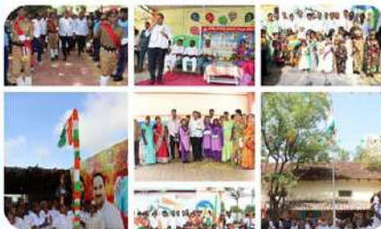
కందుకూరులో నిర్వహించిన స్వాతంత్ర్య వేడుకల దృశ్యాలు