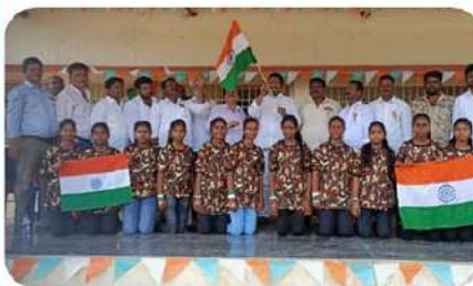
మంత్రాలయంలో నిర్వహించిన స్వాతంత్ర్య వేడుకలు