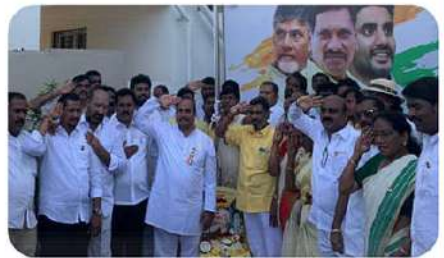
తిరుపతి పార్లమెంట్ టీడీపీ కార్యాలయంలో జాతీయ జెండాకు వందన