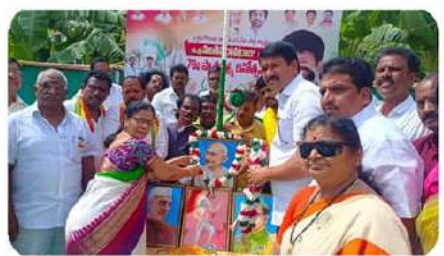
భీమవరం టీడీపీ కార్యాలయం వద్ద గాంధీ చిత్రపటానికి పూలమాల వేస్తున్న ద్విశిక్షం