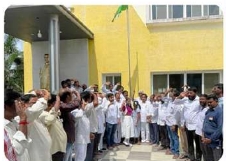
కాకినాడ జిల్లా టీడీపీ కార్యాలయంలో జెండా వందనం