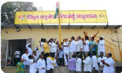
కర్నూలు టీడీపీ కార్యాలయంలో జాతీయ జెండా ఎగురవేస్తున్న ద్విశిక్షం