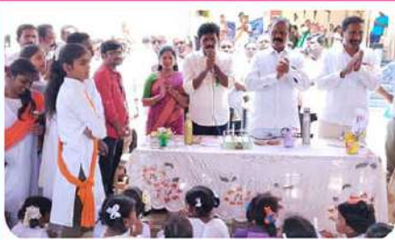
విజయవాడ అశోకనగర్ టీడీపీ కార్యాలయంలో..