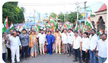
రాజమహేంద్రవరంలో హర్ షర్ తిరంగా ర్యాలీ