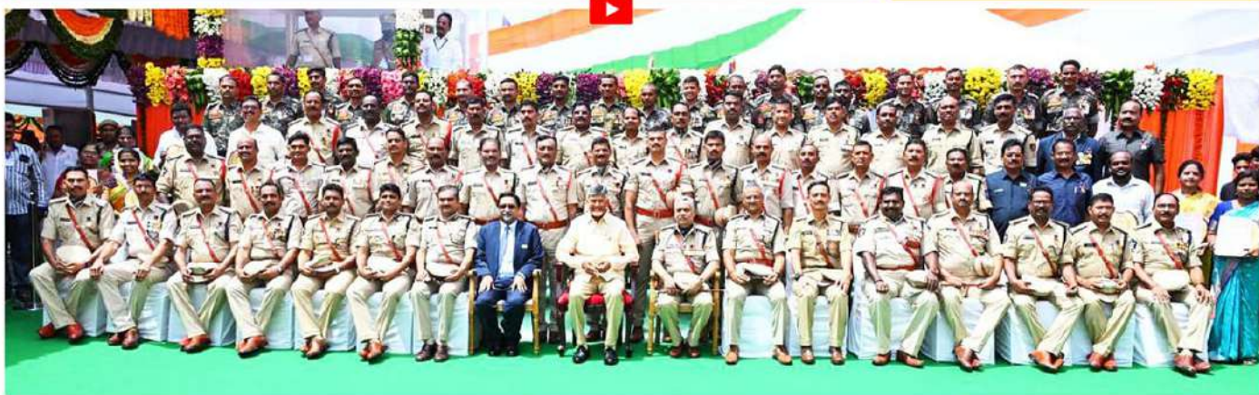
స్వాతంత్ర్య దినోత్సవం సందర్భంగా విజయవాడలోని ఇందిరాగాంధీ స్టేడియంలో గురువారం జాతీయ జెండాను ఎగురవేసిన అనంతరం ముఖ్యమంత్రి చంద్రబాబుతో సీఎస్, పోలీస్ ఉన్నతాధికారుల గ్రూప్ ఫోటో.