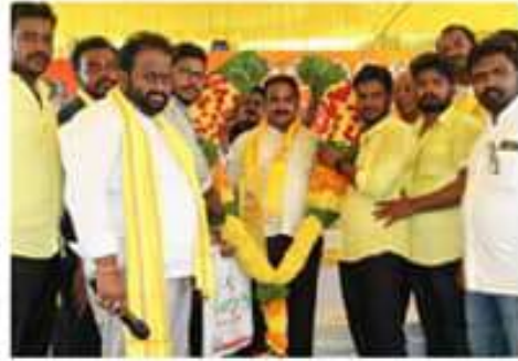
కందుకూరు ప్రజలకు త్వరలో కృష్ణా జలాలు రావడం వల్ల ఉర్రూతలూగడం జరుగుతుంది అంటే సీఎం చంద్రబాబు, మంత్రి తోనే పోటీ పోటీ ఇచ్చారు.