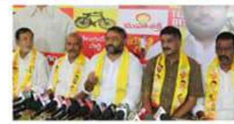
నేరూరు పార్లమెంట్ నియోజకవర్గం ఎమ్మెల్యే సీఎంకే వ్యూహం పక్కం వేరుచేసి, పక్కం వేరుచేసి, పక్కం వేరుచేసి...