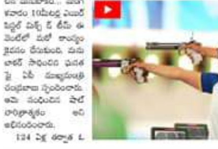
124 ఏళ్ల తర్వాత...

అమరావతి ప్రెక్షన్లకు: మంగళవారం 10 ఏళ్ల యువర్ విక్టోరియా టీవీ ఆవిర్భవించింది. అలాగే మన ప్రభుత్వం చేసిన కృషిపై ప్రశంసలు తెలిపారు. అలాగే మన ప్రభుత్వం చేసిన కృషిపై ప్రశంసలు తెలిపారు.