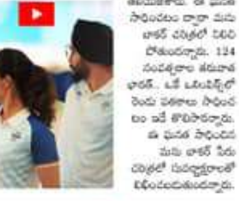
124 ఏళ్ల తర్వాత...

అమరావతి ప్రెక్షన్లకు: పార్టీలో మన ప్రభుత్వం చేసిన కృషిపై ప్రశంసలు తెలిపారు. అలాగే మన ప్రభుత్వం చేసిన కృషిపై ప్రశంసలు తెలిపారు.