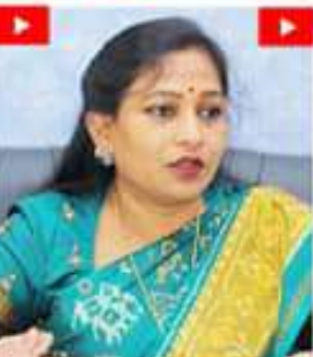
గంజాయి గురించి సమాచారం అందించే వారికి అనంతపురం ఉక్మోపాదానం ఉంది. అంతర్జాతీయ సెలవులను నిర్వహించాలి. మహిళల ఉద్యమం పెళ్లవేసి. గణ ప్రభుత్వంలో పోలీసులకు పదవీ బదిలీని.

అంతర్జాతీయ సెలవులను నిర్వహించాలి. మహిళల ఉద్యమం పెళ్లవేసి. గణ ప్రభుత్వంలో పోలీసులకు పదవీ బదిలీని. అంతర్జాతీయ సెలవులను నిర్వహించాలి. మహిళల ఉద్యమం పెళ్లవేసి. గణ ప్రభుత్వంలో పోలీసులకు పదవీ బదిలీని.