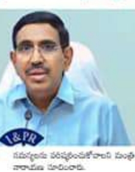
నారాయణ స్పెషల్ డైవ్ భవన నిర్మాణాల పెండింగ్ ధరఖాస్తులపై

అధికారులకు సీనియర్లు చంద్రబాబు అనేకం. అంటే దళితులకు ఆర్థిక భద్రత కల్పించాలి. అంటే దళితులకు ఆర్థిక భద్రత కల్పించాలి. అంటే దళితులకు ఆర్థిక భద్రత కల్పించాలి.