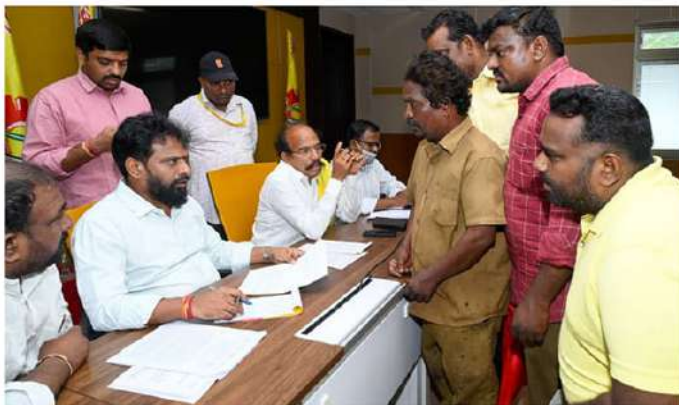
తగిన న్యాయం చేస్తామని తెలిపారు.