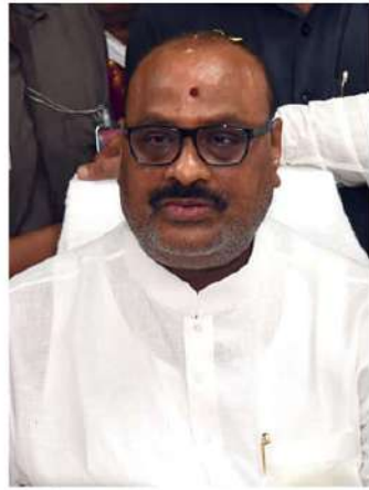
(పీఎంఎస్) చర్య విధానం అనుసరించేలా చేస్తామన్నారు. 4లక్షల మంది రైతులు ఏరాంటి రసాయనాలు వాడకుండా విత్తన దళ నుంచి విత్తు దళవరకు స్థానికంగా 1.84 లక్షల హెక్టార్ల విస్తీర్ణంలో ప్రకృతి వ్యవసాయ పద్ధతి అనుసరించేలా చేస్తామన్నారు. నిరుపేద రైతుకూలి కుటుంబాలచే 5.10 లక్షల పెరిటి కోటలను పెంచడం, ఆందులో 1.09 లక్షల పెరిటి కోటలు ఏదాని పాదవనా ఉండేలా చేయడం. 3.18 లక్షలమంది రైతులకు ప్రకృతి వ్యవసాయ అభ్యాసకులుగా సర్టిఫికేట్లు జారీ చేయడం ప్రభుత్వ ప్రణాళికగా వివరించారు.

అయితే దేశాల నుంచి వస్తున్న డిమాండ్ ను మరియూ భూమి పరిరక్షణను దృష్టిలో ఉంచుకొని మాంచు బాధ్యతగా ఈ అవార్డు కింద ప్రకటించిన 3,30,000 యూరోలను (రూ. 3కోట్లు) ఏసీఎన్ఎఫ్ గ్రోబల్ స్ట్రాటెజీలో పక్కటి వ్యవసాయ విస్తరణకు వినియోగిస్తామన్నారు. ఈ అవార్డు ఇతర దేశాల్లో ఏసీఎన్ఎఫ్ కార్యక్రమాల విస్తరణకు దోహద పడుతుందన్న ఆశాభావం వ్యక్తం చేశారు. రైతులు తాము సంపాదించిన నైపుణ్యాన్ని ఇతర దేశాల్లో రైతులలో పంపిణీ ప్రకృతి వ్యవసాయ విస్తరణకు కృషి చేయగలరన్న ఆశాభావం వ్యక్తం చేశారు. అలాగే, ప్రభుత్వ మరియు ప్రజా సంఘాల భాగస్వామ్యంతో వాతావరణ సుమతుల్యత, సరైన ఆహార వ్యవస్థల కోసం ఆటోమగు వర్గాలకు చెందిన రైతుల నాయకత్వంలో గ్రోబల్ స్ట్రాటెజీలో జరుగుతున్న ఉద్యమాలు వేగవంతానికి ఈ గుర్తింపు ఉత్తమిస్తుందన్నారు. గ్రోబల్ స్ట్రాటెజీ దాఖ్యత్వ సంస్థలు చేతులు కలిపి బ్యూట్ర కార్యక్రమానికి సహకారం అందించాలని ఈ సందర్భంగా మంత్రి అచ్చెన్నయ్య కోరారు. 2024 -25 ప్రభుత్వ మంత్రిత్వ వివరణలో, 13 లక్షల మంది రైతులతో 6.64 లక్షల హెక్టార్లలో ప్రకృతి వ్యవసాయం చేయిస్తామన్నారు. అందులో 80శాతం రైతులు రుతుపవనానికి ముందు పొడి విత్తనాలు