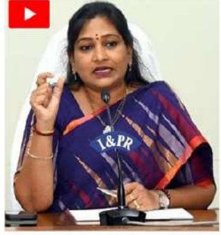
వాపోయారు. ఈ మేరకు సోమవారం గుంటూరు ఎస్పీ కార్యాలయంలో ఫిర్యాదు చేశారు. ఈ ఘటన