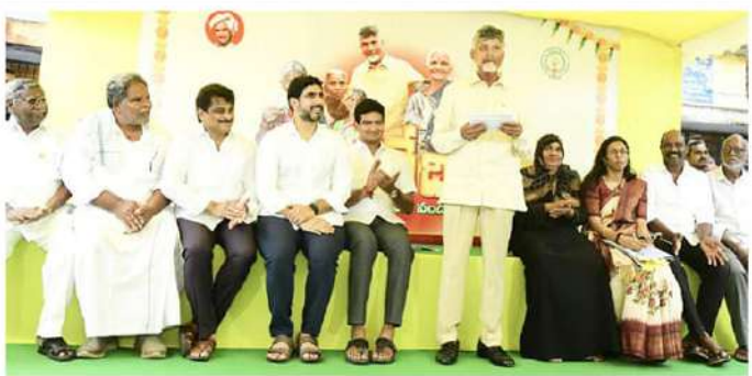
పంపిణీ చేతకాకపోతే ఇంటికి వెళ్ళాలని గత పాలకులకు చెప్పా

పెన్నకల సమయంలో వారంటిద్దోర్లో పెన్నన పంపిణీ చేయడంపై పెన్నకల కమిషన్ ఆదేశాలు ఇచ్చింది. సచివాలయ నిబంధనల్లో పెన్నన పంచాలని చెప్పి నాటి ప్రభుత్వం కుదరదని చెప్పింది. పంపిణీ చేయాలనడం చేతకాకపోతే ఇంటికి వెళ్ళాలని చెప్పారు. మందలించడంలో పెన్న కోసం వృద్ధులను సచివాలయాల చుట్టూ తిప్పి 33 మంది ప్రాణాలు తీశారు. ఇళ్లవద్దనే పెన్నన్ ఇవ్వాలని మేము పోరాడినా వినలేదు. అందుకే ఇప్పుడు 1.20లక్షల మంది సచివాలయ నిబంధనల్లో పెన్నన్ ఆందిస్తున్నాం. గత పాలకులు నోచిప్పితే అబద్ధాలు చెప్పారు. ఇదే క్షణం అబద్ధాలు చెప్పి బరికారు. నేను, పవన్ ఎన్నికల ముందు జట్టు కట్టడానికి కారణం ప్రభుత్వ వ్యతిరేక ఓటు చీలకూడదని. తర్వాత బీజేపీతో కలిసి రాష్ట్ర ప్రయోజనాలు అలిపారు. ప్రజలు గెలవాలి రాష్ట్రం నిలవాలన్న ఆలోచనలో ముందుకు వెళ్ళాలి. నా పరిశ్రమలో ఎన్ని కలు చూశారు కానీ... ఇంతటి ఫలితాలు ఎప్పుడూ రాలేదు. మేము పేదకులుగా ఉంటాం తప్ప పెత్తందారులుగా ఉండే వాళ్ళం కాదు. మీరు మౌనం ఇచ్చింది అధికారం కాదు... బాధ్యత అని సీఎం చంద్రబాబు స్పష్టం చేశారు.