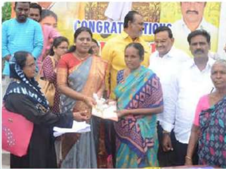
పంచన్ పంపిణీ చేసిన ఎమ్మెల్యే తంగిరాల సౌమ్య