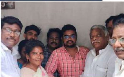
నగదు అందజేస్తున్న జ్యోతుల నెవ్రూ