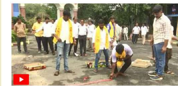
గుంటూరు: ఆచార్య నాగార్జున యూనివర్సిటీ (ఏఎన్ యూ) వీసీ రాజకీయ పడవి నుంచి తప్పుకోవటంతో విద్యార్థులు సంబరాలు చేసుకున్నారు. రాజనామా చేస్తున్నట్లు రెండు రోజుల శ్రీకమే ప్రకటించిన ఆయన.. సోమవారం ఆ వార్తకల నుంచి వైదొలిగారు. డింకో వర్సిటీ