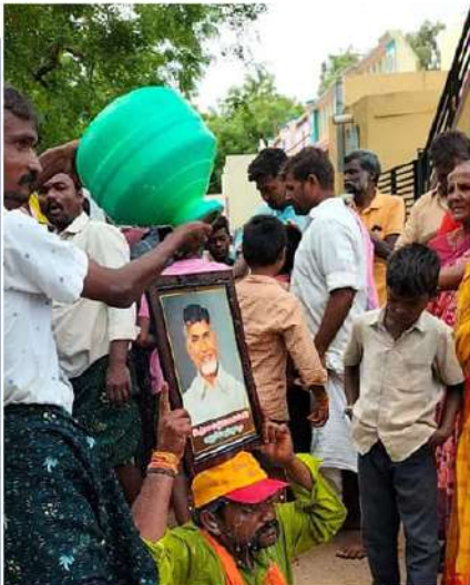
పిన్న్ పింఛువై బి దివ్యాంగుడి ఆనందం