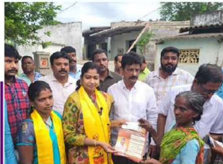
ఎమ్మెల్యే విజయశ్రీ ఆధ్వర్యంలో పింఛన్ పంపిణీ