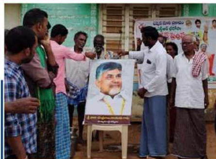
వెంకటగిరిలో చంద్రబాబుకు పాలాభిషేకం