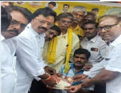
ఎమ్మెల్యే ఆదిమూలం ఆధ్వర్యంలో