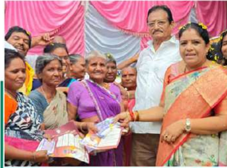
లబ్ధిదారులకు మంత్రి గుమ్మడి సంద్యారాణి