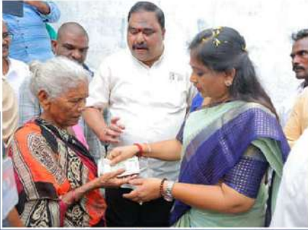
లజ్జిదారులకు పంచన్ అందజేస్తున్న వూరిమంత్రి