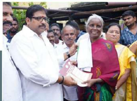
ఒంగోలు ఎమ్మెల్యే దామచర్ల ఆధ్వర్యంలో