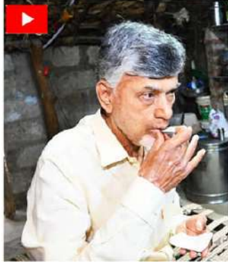
(2వ పేజీ తరువాయి)

మరింత సంక్షేమం అందిస్తుంది. మంచి ప్రభుత్వం ఉంటే అందరికీ అందగా ఉండి వెనుకబాటు బాటును కల్పిస్తుంది. గత ప్రభుత్వం సరిగా పాలన చేసి ఉంటే ఇప్పుడు ఈ సమస్యలు ఉండేవి కాదు. మాది ప్రజల ప్రభుత్వం... ప్రజా ప్రభుత్వం. నిరుంతరం మీ కోసం పని చేస్తాం. నిండు మనసుతో మా ప్రభుత్వాన్ని ఆత్మర్పణ దించాలని సీఎం చంద్రబాబు కోరారు.