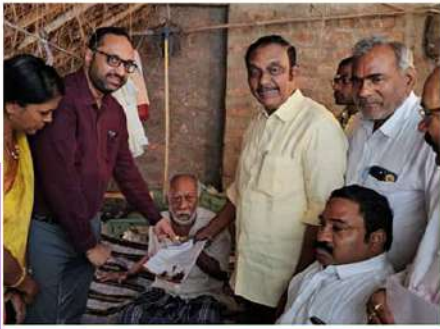
నరసరావుపేటలో పంచన్ పంపిణీ చేసిన ఎమ్మెల్యే చదలవాడ