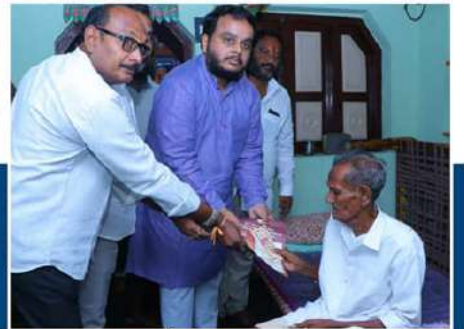
పంచన్ పంపిణీ చేస్తున్న చింతకాయల విజయ్