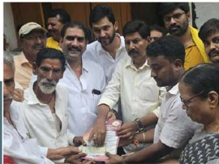
గండి బాబ్జి ఆధ్వర్యంలో పంచన్ పంపిణీ