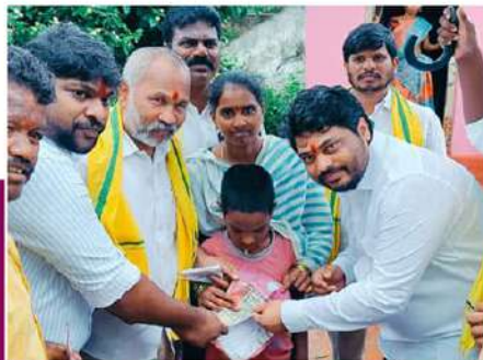
కిడారి శ్రావణ్ కుమార్ ఆధ్వర్యంలో పంచన్ పంపిణీ