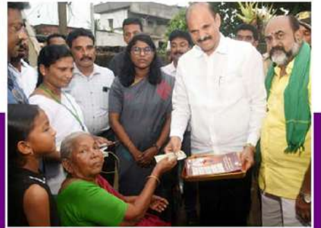
నూజివీడులో మంత్రి కొలుసు పార్థసారథి