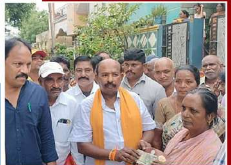
పింఛన్ పంపిణీ చేసిన ఎమ్మెల్యే కురుగొండ్ల