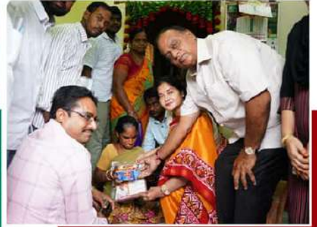
కోవ్వూరులో పింఛన్ పంపిణీ చేసిన వెవిరెడ్డి దంపతులు