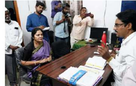
తేను కూడా సమాధి కాకూడదని ఆదేశించారు. దోచుల వ్యాప్తి జరకుండా పటిష్ట చర్యలు తీసుకోవాలని కోరారు.

కోపూరు (వైశ్యరథం): బుద్ధిరెడ్డిపాలెం మండల కేంద్రంలోని సగర పంచాయతీ కార్యాలయానికి శనివారం ఎమ్మెల్యే వేమిరెడ్డి ప్రశాంతిరెడ్డి ఆకస్మికంగా తనిఖీ చేశారు. ఆమె.. కమిషనరీ రమణజాబుని అడిగి వివరాలు తెలుసుకున్నారు. కార్యాలయంలో సిబ్బంది పనితీరును పరిశీలించారు. పట్టణంలో ప్రజలు ఎదుర్కొంటున్న సమస్యలపై ఆరా తీశారు. ప్రధానంగా నీటి వసతి లేక ఇబ్బందులు పడుతున్నారని పలువురు ఎమ్మెల్యే ప్రశాంతిరెడ్డి దృష్టికి తెచ్చారు. దాంతో ఆ సమస్యలపై పూర్తి స్థాయిలో దృష్టి సారించి పరిష్కరించాలని ఎమ్మెల్యే కమిషనరీని ఆదేశించారు. అదేవిధంగా నీటి విస్తరణ, పారిశుధ్యం, ప్రజా మరుగుదొడ్ల సమస్యలపై కూడా ఎమ్మెల్యే ప్రశాంతిరెడ్డి ఆరా తీశారు. బుద్ధి పట్టణ అభివృద్ధిపై యాజ్ఞప్తినైవే తయారు చేయాలని, ఎక్కడా నిర్లక్ష్యం వద్దని ప్రశాంతిరెడ్డి ఆదేశించారు. ప్రస్తుతం జిల్లాలో డయేరియా తేసులు ప్రజలకున్న సేవలపై దీనిపై దృష్టి సారించాలన్నారు. ఒక్క డయేరియా