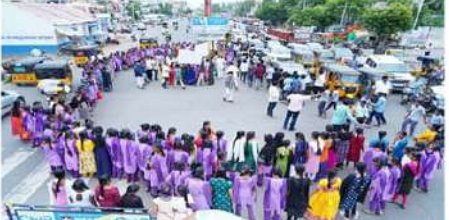
అనంతరం విద్యార్థులు పట్టణభివృద్ధం మెయిన్ రోడ్డులో మాసవసారం