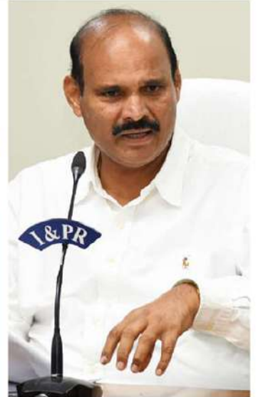
తొలగించే చార్టురూమ్ ను సత్కరమే చేపట్టాలని నిర్ణయించారు. చర్చాశాల ప్రారంభమైనందున సీజనల్ వ్యాధులు ప్రజల్లో అవకాశం ఉండటంతో.. ప్రజారోగ్య పరిరక్షణకు సహాయకం కావాలని సూచించారు. ఆధ్యాత్మికంగా మారిన రోడ్డు, రహదారులపై పాల్ వాల్క్స్ ను పూర్తిచేయడం అవసరమైన చర్యలు తీసుకోవాలని ఆర్ అండ్ డీఎ చేశారు.