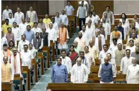
స్థానికీ కాంగ్రెస్ అగ్రనేత రాహుల్ గాంధీ చేసిన రాజీనామాను స్పీకర్ ఆమోదించారు. ఇటీవల జరిగిన లోక్ సభ ఎన్నికల్లో పోటీ చేసిన రెండు స్థానాల్లోనూ రాహుల్ విజయం సాధించిన సంగతి తెలిసింది. ఆనంతరం పయనాద్ ను వదులుకుని రాయచోటి ఎంపీగా కొనసాగాలని ఆయన నిర్ణయించుకున్నారు.