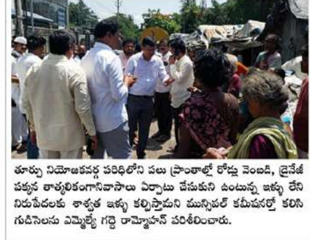
తూర్పు నియోజకవర్గ పరిధిలోని పలు ప్రాంతాల్లో రోడ్డు వెంబడి, ప్రైవేట్ పక్కన కార్యకర్తలను సహజంగా ఏర్పాటు చేసేటటువంటి ఉన్నత స్థాయి నిరుద్యోగులకు శాశ్వత జాబ్ కల్పిస్తామని మునిసిపల్ కమిషనర్ కలిసి గుడిసలను ఎమ్మెల్యే గద్దె రామ్మోహన్ పరిశీలించారు.