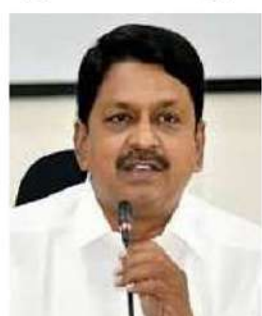
మరువలేనని అన్నారు. జిల్లా రైతాంగాన్ని ఆదుకునేందుకు తక్కి వంచన లేకుండా