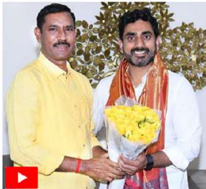
సంపూర్ణ మద్దతు: లోకేశ్ అనంతరం తెలుగుదేశం పార్టీ జాతీయ ప్రధాన