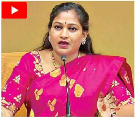
మార్కాని విమర్శలు గుప్పించారు. వైసీపీ నాయకులు కూడా గంజాయిని అమ్ముతుంటున్నారన్నారు. గంజాయి మాఫియాపై ఉక్కుపాదం మోపు తామని