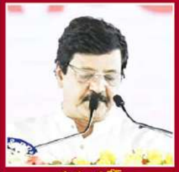
కందుల దుర్గా సాంస్కృతిక, సహకారం