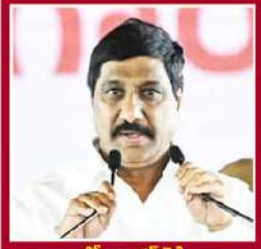
డీ. జనార్దన్ రెడ్డి రోడ్లు, భవనాలు, మౌలిక వసతులు, పట్టణాలు