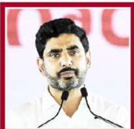
నారా లోకేశ్ విద్యా, విద్యుత్, ఐటీ, ఎలక్ట్రానిక్స్, అండ్ కమ్యూనికేషన్స్, యువ టెక్, గవర్నెన్స్ లెటర్సు