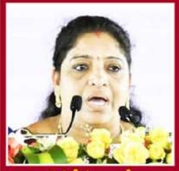
గుమ్మడి సంధ్యారాణి మహిళా శిశు సంక్షేమం, గిరిజన సంక్షేమం