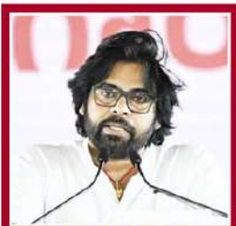
కొనేటిల పవన్ కల్యాణ్ పంచాయతీరాజ్, గ్రామీణాభివృద్ధి, శాసనసభ సరఫరా, పర్యావరణం, ఆటవీలు, సైన్స్ అండ్ టెక్నాలజీ