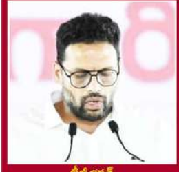
బీజీ భారత్ పరిశ్రమలు, వాణిజ్యం, ఆహార పట్టి 00