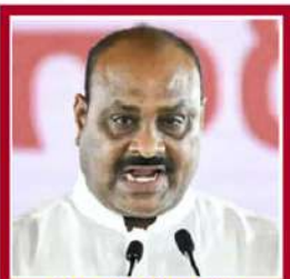
కీలకరావు అచ్చెన్నాయుడు వ్యవసాయం, సహకార, మార్కెటింగ్, పశుసంరక్షణ