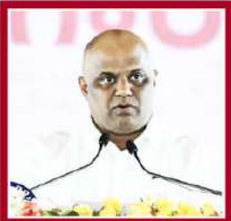
అనగాని సంకర్ ప్రసాద్ రెవెన్యూ, స్థానిక సంస్థలు, నిర్మాణం