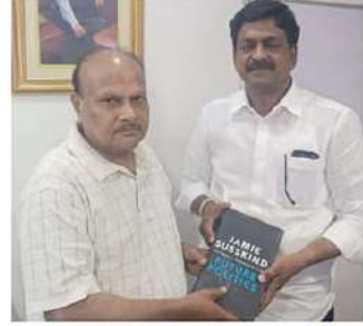
తెలుగుదేశం పార్టీ సీనియర్ నాయకుడు, మాజీ అధికారి మంత్రి యనమల రామకృష్ణుడిని శుక్రవారం రాత్రి ముఖ్యమంత్రి చంద్రబాబు మాజీ అధికారి మంత్రి పదవిని చేపట్టారు.