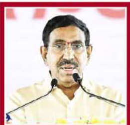
పొంగుల నారాయణ మున్సిపల్ రివల్యూషన్, పట్టణాభివృద్ధి