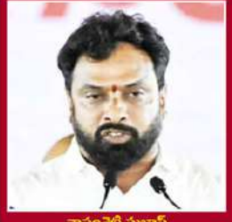
వారంపల్లి సుబ్బా కార్మిక, పరిశ్రమలు, కుటుంబ సంక్షేమం