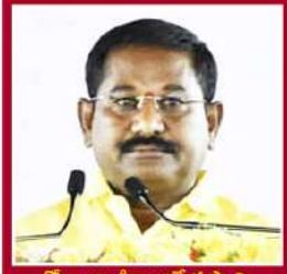
డోలా బాబు సాంఘిక సంక్షేమం, సహకారం, గ్రామ బాండ్ల క్షరణశాఖలు