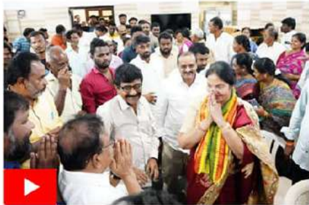
సంతకాలు చేయడం... ఆయన నిబద్ధతకు నిదర్శనమన్నారు. తొలి సంకం మోగ డిఎస్సీ పై పెట్టడం, 16,347 టీవర్ ఉద్యోగాల భద్రీ గ్రీన్ సిగ్నల్ ఇవ్వారన్నారు. చదువుకున్న యువత ఈ ఎన్నికల్లో డిఎస్సీ వైపు నిలబడ్డారని, వారి నమ్మకాన్ని తొలి సంకంతో సీఎం చంద్రబాబు నాయుడు నిలబెట్టారన్నారు. వైసీపీ తెచ్చిన ల్యాండ్ ట్రిటిలింగ్ దబ్బణ్ని రద్దు