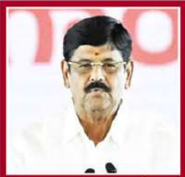
అనం రామచంద్రుడు వేదాలయ