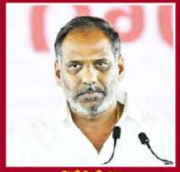
గొట్టిపాటి రవి విద్యుత్ శాఖ