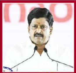
పయ్యపుల కేశవ్ ఆర్థికం, ప్రకాశక, హాగింగ్ పనులు