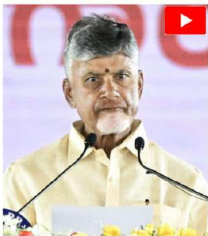
ముఖ్యమంత్రి నారా చంద్రబాబునాయుడు పీఠాధిపతి పదవిలో శాఖ, శాంతిభద్రతలు