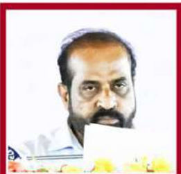
సంకరుమార్ యాదవ్ ఆరోగ్యం, కుటుంబ సంక్షేమం, వైద్య నిధి