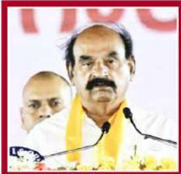
ఎన్.ఎమ్.డి.మర్త్యుని స్వయం-శాఖ, మైదాన సంక్షేమం