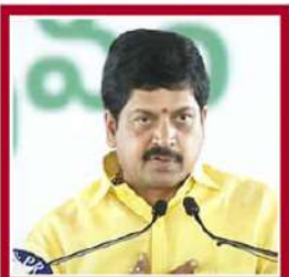
కొల్లు రవీంద్ర గనులు, జియోలాజీ, ఎన్వైజీ