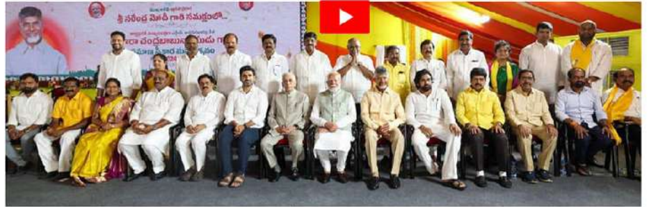
ముఖ్యమంత్రిగా చంద్రబాబుతో పాటు ప్రమాణస్వీకారం చేసిన శేజినేట్ మంత్రిలతో ప్రధాని నరేంద్ర మోదీ, గవర్నర్ అబ్దుల్ నజీర్ గ్రూప్ ఫోటో