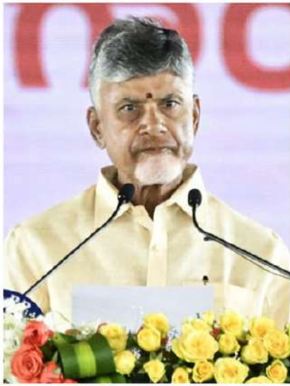
ఆంధ్రప్రదేశ్ నూతన ముఖ్యమంత్రిగా ప్రమాణస్వీకారం చేసిన నారా చంద్రబాబునాయుడు