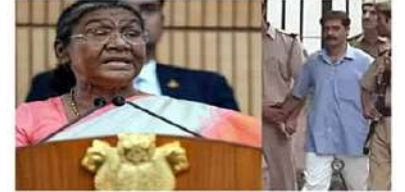
న్యాయస్థానం మరణిక్ష విధించింది.