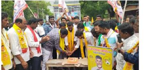
జనసేన పార్టీ నాయకులు, కార్యకర్తలు, అభిమానులు పెద్ద సంఖ్యలో పాల్గొన్నారు.

పత్తికొండ (చైతన్యరథం): ముఖ్యమంత్రిగా చంద్రబాబు నాయుడు, ఇతర మంత్రుల ప్రమాణ స్వీకారోత్సవం సందర్భంగా పత్తికొండలో తెలుగు యువత ద్విచక్రవాహన ర్యాలీ నిర్వహించారు. పత్తికొండ మాజైద్ యార్డ్ వద్ద ఎన్టీఆర్ విగ్రహానికి పాలివేతం చేశారు. అనంతరం పట్టణవిడుల గుండా అంజేద్దర్ కూడలి వరకు భారీ ర్యాలీ నిర్వహించారు. అనంతరం నాలుగు స్తంభాల కూడలి వద్ద ముఖ్యమంత్రి చిత్రపటానికి పాలివేతం చేసి, కేకు కోసి, మిఠాయిలు పంచిపెట్టారు. బాణాసంచా కాల్చి సంతోషాలు చేసుకున్నారు. ఈ కార్యక్రమంలో తెలుగుదేశం,