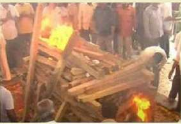
రామోజీ పాద మోక్షం అంజ్యక్తియలు