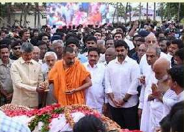
రామోజీ పాద మోక్షం వున్నాను. చంద్రబాబు