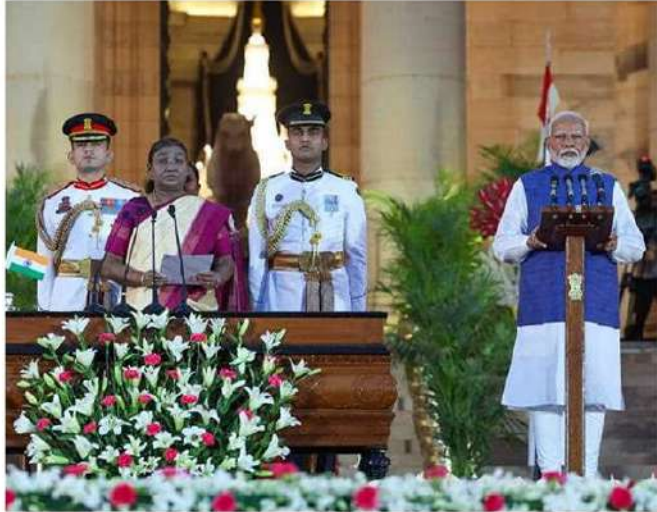
భారత ప్రధానిగా పదేండ్లమోదిలో ప్రమాణ స్వీకారం చేయిన క్రిష్ణ రావుపతి ద్రౌపది ముర్ము