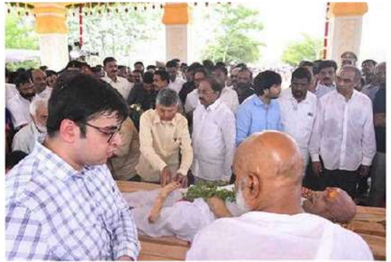
ఫిల్మ్ నెట్లోని స్మృతిపాపం వద్ద రామోజీ పాద మోక్షస్థ, తెదేపా అగ్రనేత చంద్రబాబు నాయుడు, అంజ్యక్తియలలో వాళ్లన్న చంద్రబాబు