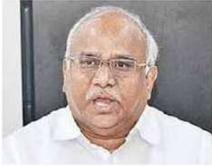
కొనసాగిస్తామని, ఈ విషయంలో ఎలాంటి సమస్య లేదని తేల్చి చెప్పారు.