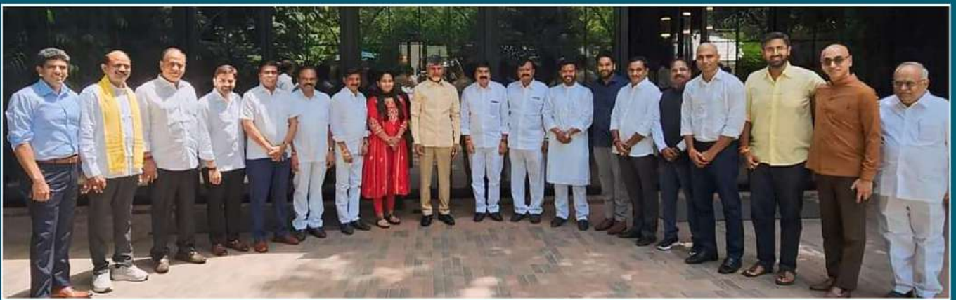
ధిల్లీలోని మాజీ ఎంపీ గల్లా జయదేవ్ నివాసంలో సమావేశమైన అనంతరం టీడీపీ అభినేత చంద్రబాబుతో పార్టీ ఎంపీల గ్రూప్ ఫోటో