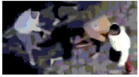
వచ్చే వరకూ విద్యార్థులు ఎవరూ బయటకు రావద్దని పాక్ రాయబార కార్యాలయం తెలిపింది. ప్రస్తుతం మధ్య ఆసియా దేశంలో దాదాపు 10,000 మంది పాకిస్థాన్ విద్యార్థులు ఉన్నట్లు నివేదికలు చెబుతున్నాయి.

ప్రస్తుతానికి పరిస్థితి ప్రశాంతంగానే ఉన్నప్పటికీ, విద్యార్థులు ఎవరూ బయటకు రావద్దు. ఏదైనా సమస్య ఉంటే వెంటనే ఎంబసీని సంప్రదించాలి' అని హెచ్చరించి. ఈ మేరకు 24 గంటలపాటు అందుబాటులో ఉండే పోస్ నంబర్ను షేర్ చేసింది. విదేశీ వ్యవహారాల మంత్రిత్వ శాఖ గణాంకాల ప్రకారం.. కిర్గిస్థాన్లో దాదాపు 14,500 మంది భారతీయ విద్యార్థులు వివసిస్తున్నారు. మరోవైపు దాడుల నేపథ్యంలో పాకిస్థాన్ ప్రభుత్వం కూడా అప్రమత్తమైంది. అక్కడి పాక్ విద్యార్థులు అప్రమత్తంగా ఉండాలని, బయటకు రావద్దంటూ సూచించింది. బిస్కెట్లోని కొన్ని వైద్య విశ్వవిద్యాలయాల హాస్టళ్లు పాకిస్థాన్లతో సహా విదేశీ విద్యార్థుల ప్రైవేట్ నివాసాలపై దాడులు జరిగినట్లు తెలిసింది. అయితే, ఈ దాడిలో పాక్కు చెందిన విద్యార్థుల మరణాలు, గాయాలపై వివేదికలు వచ్చినప్పటికీ తమకు ఇప్పటి వరకూ ఎలాంటి సమాచారం అందలేదని తెలిసింది. పరిస్థితి సాధారణ స్థితికి