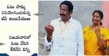
ఓటు హక్కు వినియోగించుకున్న టి.టి.పీ అంజనేయులు