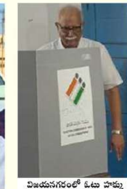
విజయనగరంలో ఓటు హక్కు వినియోగించుకుంటున్న కేంద్ర మాజీ మంత్రి ఆశోక్ గజపతిరాజు