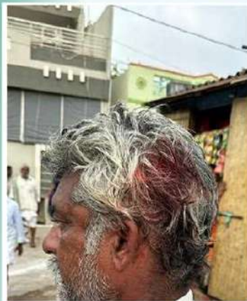
రెంటచింతలలో టీడీపీ కార్యకర్తపై దాడి