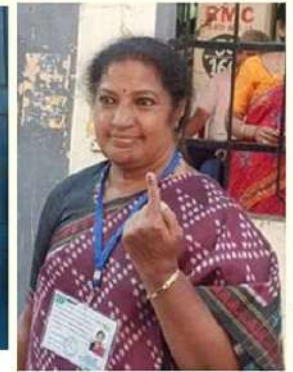
ఓటు హక్కు వినియోగించుకున్న టి.టి.పీ రాష్ట్ర అధ్యక్షురాలు పురందేశ్వరి