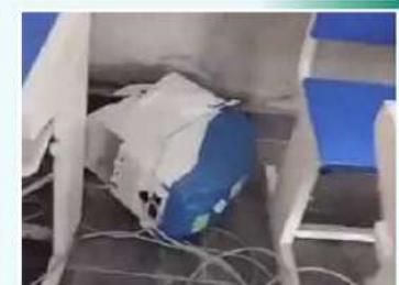
పల్నాడు రెంటచింతల మండలం జెడ్డిపాలెం బాత్ నెం 215లో ఈ ఏం పగలుగొట్టిన వైసీపీ కార్యకర్తలు