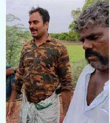
కర్నూలు జిల్లా మల్లేపల్లి గ్రామంలో గాయపడిన టీడీపీ కార్యకర్త