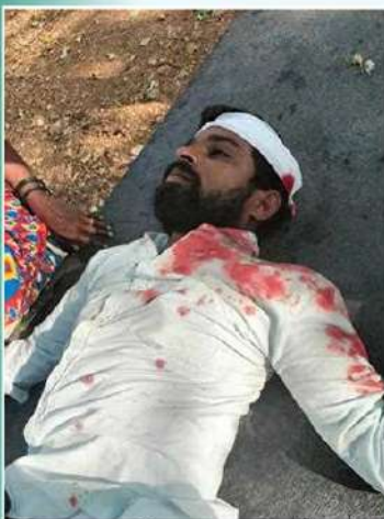
కడప జిల్లా చాపపాడు మండలం చిన్న గోకులూరు గ్రామంలో వైసీపీ దాడిలో గాయపడిన టీడీపీ కార్యకర్త