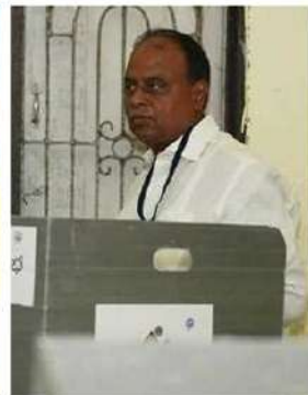
ఓటు హక్కు వినియోగించుకుంటున్న మేమిరెడ్డి దంపతులు