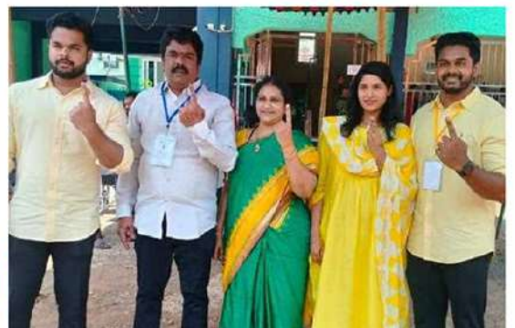
ఓటు వేసిన అనంతరం సీరా చూపుతున్న చౌదా ఉమా కుటుంబ సభ్యులు