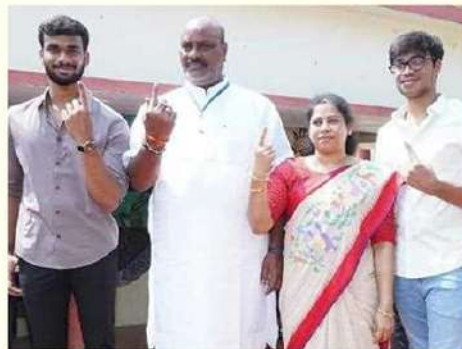
బొక్కలిలో కుటుంబ సభ్యులతో కలిసి ఓటు హక్కును వినియోగించుకున్న డి.టి.పీ రాష్ట్ర అధ్యక్షుడు అచ్చెన్నాయుడు