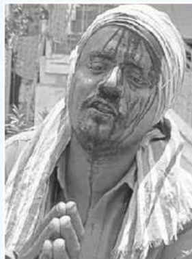
మైదుకూరు నియోజకవర్గం పుల్లూరులో వైసీపీ నాయకుల దాడిలో తీవ్రంగా గాయపడిన టీడీపీ దళిత కార్యకర్త