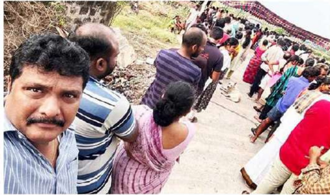
చెప్పుకున్నట్లుయిందని పరిశీలకులు వ్యాఖ్యానించారు.