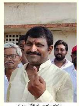
ఓటు వేసిన అనంతరం డి.టి.పీ జాతీయ ప్రధాన కార్యదర్శి టీదా రవీచంద్రయాదవ్