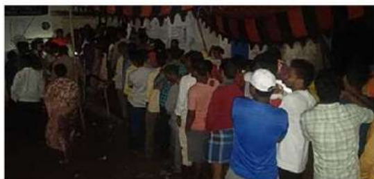
అల్లూరి సీతారామరాజు జిల్లాలోని ఎటులంలో రాత్రి 7 గంటల దాదాపు పోలింగ్ కేంద్రం వద్ద ఓటింగ్ నందుకు వేచిచూస్తున్న ఓటర్లు

అమరావతి, చైతన్యరథం: ఇదే జగన్ రెడ్డి అరాచక పాలనకు నిరసనగా సోమ వారం నాడు జరిగిన పోలింగ్ ఉమ్మడి ఆంధ్రప్రదేశ్, నవ్యాంధ్రల రాజకీయ చరిత్ర లో ఒక కొత్తరేఖాంశం సృష్టించినది. సోమ వారం నాడు జరిగిన పోలింగ్ సరళిని బట్టి ఈ ఎన్నికల్లో పోలింగ్ ఎట్టి పరిస్థితుల్లోనూ 80 శాతం దాటుకుందని ఎన్నికల విశ్లేషకుల అభిప్రాయం. నిర్ణీత పోలింగ్ సమయానికి కంటే ముందుగానే రాష్ట్ర వ్యాప్తంగా పలుచోట్ల చైతన్య వంతెనల ఓటర్లు భారాలు తీరినా కొన్ని కారణాల వలన మొదట్లో పోలింగ్ మందగమనంతో సాగిన ప్రమాణా పుంజుకొని రికార్డు నెలకొల్పి సుందీ. తీవ్రమైన ఎండ, కొన్ని చోట్ల వర్షాలు వడినా మార్పు కోసం ప్రజాస్పందన భారీగా వ్యక్తమయింది. విశ్వసనీయవర్గాల సమాచారం మేరకు నిన్ను ఉదయం ఏడు గంటలకు ప్రారంభమైన పోలింగ్ 11.30 గంటలకు 27 శాతంగా రికార్డుయింది. మధ్యాహ్నం 12 గంటలకు 34 శాతంగానూ, ఒంటి గంటలకు 42 శాతం నమోదయింది. సాయంత్రం