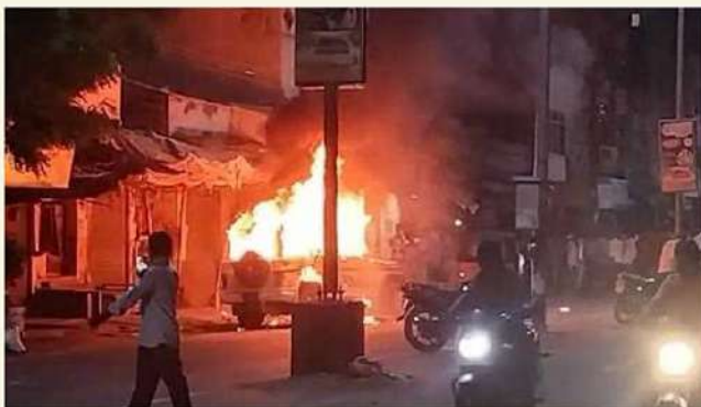
పోలీస్ అసంతోషం నరసరావుపేటలో వైసీపీ మూకల అరాచకం

అమరావతి (చైతన్యరథం): ఊహించినట్లే పాత పక్షం ఎన్నికల హింసకు తెగబడింది. ఓటమి భయంతో పోలీస్ రోజున దాడులు, దౌర్జన్యాలు, కిడ్నాప్లు, పెట్టోలు బాంబులతో చెలరేగిపోయింది. ప్రజలను భయ భ్రాంతులకు గురిచేసి.. భయానక వాతావరణం లోనే పరిస్థితి చక్కదిద్దుకునే కుట్రకు ఒడిపిపడ్డది. పార్టీ అధిష్టానం ఇటీవల డైరెక్షన్లో ద్వితీయశ్రేణి యంత్రాంగం రోడ్డుకాపు ప్రదర్శించారు. అనేకచోట్ల దౌర్జన్యాలు తెగబడి ఎన్నికలకు భంగం కలిగించే కుతంత్రాన్ని అమలు చేశారు. చాలాచోట్ల తెలుగుదేశం ఎన్నికల ఏజెంట్లను కిడ్నాప్ చేసి ఉద్రిక్త పరిస్థితులు లేవనెత్తారు. చివరిగా ఓటర్లను చెల్లాలెదురు చేసినందుకు పెట్టోల దాడులు విసిరి భయానక వాతావరణం సృష్టించారు. ఓటమి అంచనాపై వైసీపీ హింసామార్గాన్ని అనుసరించ వచ్చున్న అంచనా ఉండటంతో, తెదేపా సమర్థంగా ఎదురొంది. నందు మనం పాటిస్తూ.. ఆపనరమైన దోల ప్రతిఘటిస్తూ.. ఎన్నికల సజాతగా సాగించుకు దోహదపడింది. భయానక వాతావరణం సృష్టించి పోలీస్ కాతం తగ్గించే గరిగెత గెలుపు నల్లరపై నడకపెట్టే వైసీపీ కుట్రను.. విపక్ష కూటమి సేనలు సమర్థంగా తిప్పికొట్టింది.