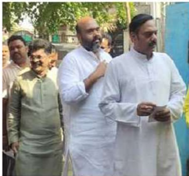
విజయనగరంలో ఓటు వేసేందుకు క్యూలో నిలబడిన కూటమి అభ్యర్థి బేబినాయన