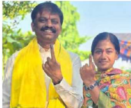
పలాసలో ఓటు వేసిన అనంతరం తన భర్త కలిసి సీరా గుర్తు చూపిస్తున్న గౌతు శీరవ