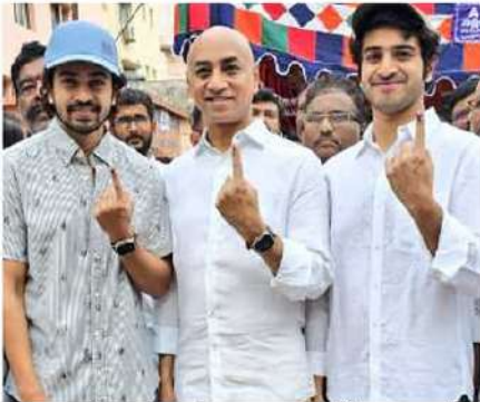
తనయులతో కలిసి ఓటు వేసిన గుంటూరు ఎంపీ గల్లా జయదేవ్