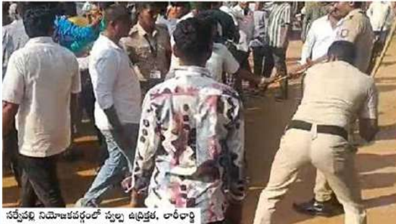
సర్వేపల్లి నియోజకవర్గంలో స్వల్ప ఉద్రిక్తత, లాఠీచార్జి