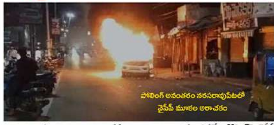
పోలింగ్ అనంతరం సరసరావువేటలో వైసీపీ మూకల అరాచకం