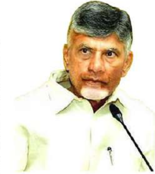
నేతలు ఎన్నికల వేళా కుట్రలు పన్నుతూ వచ్చారని మండిపడ్డారు. రాష్ట్రాన్ని కాపాడుకోవాలనే కని ప్రతి

అమరావతి(చైతన్యరథం): రాష్ట్ర భవిష్యత్ కోసం జనం ఒక కనితో ఓటు వేశారని, ఈ సారి ఊహించని ఫలితాలు చూడడంపై చూస్తూ టీడీపీ అభినేత చంద్రబాబు ఉద్బుధులన్నారు. రాష్ట్రంలో సార్వత్రిక ఎన్నికల కోసం సోమవారం ఉదయం 7 గంటల నుంచే మొదలైన పోలింగ్ సాయంత్రం 6గంటలకు ముగిసింది. 175 అసెంబ్లీ, 25 ఎంపీ స్థానాల కోసం ఈ ఎన్నికలు జరిగాయి. పలు నియోజకవర్గాల్లో కీలక నేతల మధ్య గట్టి పోటీ కొనసాగింది. ఈ నేపథ్యంలో మీడియాతో చంద్రబాబు విలేజుల్లో చేశారు. ఈసారి ఊహించని ఫలితాలు చూడడంపై చూస్తూ ఉద్బుధులన్నారు. ప్రజా స్వార్థి వైసీపీ కుట్రలు ఎక్కడక్కడ భగ్నం చేశాయన్నారు. ఓటమి భయంతో అధికార వైసీపీ