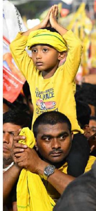
మంచి మెట్రోతో గంటా శ్రీనివాసరావును గెలిపించాల్సిందిగా కోరుతున్నారన్నారు. విశాఖ ఉన్నట్లో సైకిల్ గుర్తుకు ఓటిసి రామకృష్ణలాలును భారీ మెట్రోతో గెలిపించాలి. కూటమి అభ్యర్థులను గెలిపిస్తే.. నేను కూడా సుస్థిరమైన పాలన అందిస్తాం. మీ కోరికను నెరవేర్చగలరాజునుంచి చంద్రబాబు స్పష్టం చేశారు.