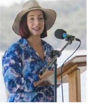
సిడ్నీ: ఆస్ట్రేలియాలో ఓ మహిళా ఎంపీకి తన సొంత నియోజకవర్గంలోనే దారుణ ఘటన ఎదురైంది. రాల్ఫ్ వేజ్ బయటకు వెళ్లిన అమెరికన్

కొందరు దుండగులు మత్తుమందు ఇవ్వడమే కాకుండా లైంగిక వేధింపులకు పాల్పడ్డారు. ఈ ఘటనను అమె స్వయంగా సోషల్ మీడియా వేదికగా వెల్లడించారు. ఆ రోజు ఏం జరిగిందో తెలియజేస్తున్నట్లు ఎంపీ బ్రిటిని లాగా (87)... ఆరోగ్య శాఖ సహాయ మంత్రిగా ఉన్నారు. ఇటీవల ఒక రోజు సాయంత్రం వేళ అమె బయటకు వెళ్ళారు. "ఎవరో గుర్తు తెలియని వ్యక్తులు మత్తు వదర్చాలు ఇచ్చి నాపై ఆత్యాచార యత్నానికి పాల్పడ్డారు. ఈ ఘటనపై పోలీసులకు ఫిర్యాదు చేశా. అనంతరం వైద్యులు నాకు పరీక్షలు నిర్వహించారు. శరీరంలో మత్తు వదర్చాలు ఉన్నట్లు ప్రువీచించారు. కానీ... చాలా దీని నేను తీసుకోలేదు" అని వెల్లడించారు. ఈ ఘటన ఏప్రిల్ 28న చోటు చేసుకున్నట్లు వివరించారు. ఇది చదవండి: హంతకులకు ఆడ్రస్ మెప్పిన ఇన్స్టా పోస్టు, మోడల్ హత్యలో