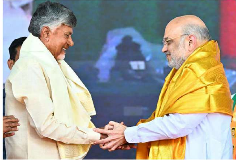
అర్చనతల చిరువ్వులు.. రేపటి వికాసక అండ్ల కుసుమలు