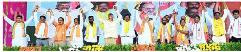
కూటమి గెలుపు.. అంజెన్ సర్కార్ అభివృద్ధి మలుపు