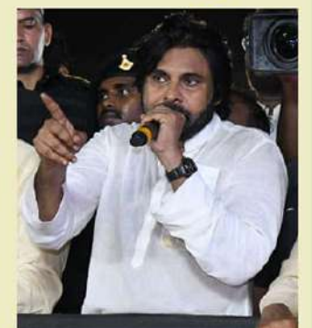
ప్రయోజనంగా మారుతుంది. వారి నైపుణ్యాన్ని పూర్తిస్థాయిలో వినియోగించే ప్రక్రియను చేపడతాం అని పవన్ స్పష్టం చేశారు.

నెల్లూరు (చైతన్యరథం): 2019 ఎన్నికల్లో దణ్ణం పెట్టి ఓట్లు అడిగిన జగన్, ఇప్పుడు వేలు చూపించి ప్రజలను భయపెట్టి ఓట్లుడిగి స్థాయికి వచ్చాడు. ఇది జగన్ అసలు నైజం అని జనసేన అభ్యర్థులు పవన్ కల్యాణ్ వ్యాఖ్యానించారు. మన మతి ఎంతో గతి అంతే అంటూ.. జగన్ ను స్పష్టంగా తీసుకుంటే యువత అలాగే తయారవుతుందన్నారు. శుక్రవారం నెల్లూరు నగరంలో జరిగిన ప్రజాగళం ఎన్నికల సభలో ఆయన తెలుగుదేశం పార్టీ జాకీరు అభ్యర్థులు నారా చంద్రబాబునాయుడుతో కలిసి పాల్గొన్నారు. ఈ సందర్భంగా పవన్ కల్యాణ్ మాట్లాడుతూ "నాకు జ్ఞానమిచ్చిన నేల నెల్లూరు. ఇంతటి పోరాటానికి, జగన్ వంటి దుర్భాషానికి తలపడటానికి నెల్లూరు రీజం చేసింది. అలాంటి నెలలో మరోసారి ఇంతటి ప్రజాభిమానం మధ్య ముందుకు రావడం ఆనందాన్నిచ్చింది. జగన్ నెలలో వ్యక్తికే వేలం ఎన్నికలలో జరిగిందా. ప్రజల సమస్యలు అతడికి పట్టవు. కేవలం ఎన్నికల వేళ మాత్రమే బయటకు వస్తాడు. బావికరాల కోసం, రాష్ట్ర భవిష్యత్తు కోసం అలోచించే మనస్సు అతడికి లేదు అని దుఃఖమైతారు.