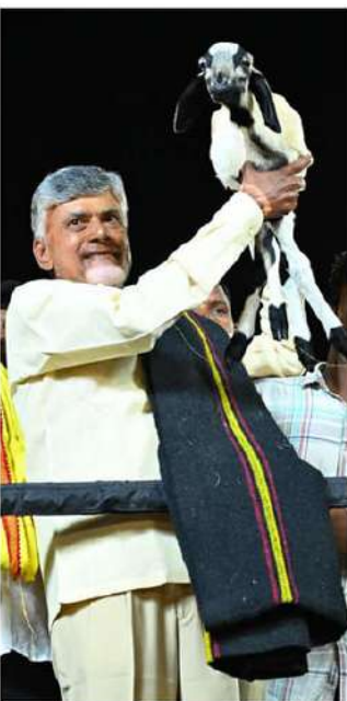
కూడా న్యాయం జరిగింది. మళ్ళీ మన ప్రభుత్వంలో ఎబిసీటి కేటగిరీలు పెట్టి మాదిగలకు న్యాయం చేస్తానని చంద్రబాబు హామీ ఇచ్చారు.