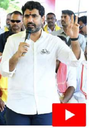
- వివరాలు 6 పేజీలో..