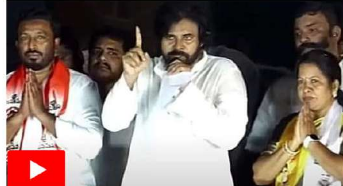
అనుమతులు ఉంటాయన్నారు. సినిమాల్లో మార్పులు మారు గంటల సమయం పడుతుంది.. కానీ విజ జీవితంలో మార్పు కావాలంటే దేశాభివృద్ధి ప్రయత్నం కాల్పితం వల్లనే అనేదన వ్యక్తం చేశారు. చిన్న బిల్లులకు ఇచ్చే చిట్కాల్లో కూడా 65 కోట్ల రూపాయలు అప్పుడే దోచే శారని విమర్శించారు. జగన్ సారా వ్యాపార, రక్షణ వ్యాపార అని అంటున్నారు. వైసీపీకి ఈ ఎన్నికల్లో ఎందుకు ఓట్లు వేయాలి అన్న సామాజిక వర్గం.. ఆ వర్గం వైసీపీ నేతలను నిరదీయాలన్నారు. కామ్రాడు రిజిస్ట్రేషన్లకు ఒప్పుకోని వ్యక్తి వైసీపీ కాబట్టే అభివృద్ధిలకు కొనసాగుతున్నారని చెప్పి కొచ్చారు. వైసీపీ అధికారంలోకి వస్తే దున్ను భూమిని, ఇళ్లను సైతం జగన్ లోకం చేసుకుంటారని అంటున్నారు. కామ్రాడు పోటీ చేస్తున్న విశాఖలో మధ్యం ఏరులై పాకుకోవడం ముందే వచ్చారు. పోలీసులకు సరెండర్ తీవ్ర కింద 750 కోట్ల రూపాయలు ఎందుకు ఇచ్చి లేదని ప్రశ్నించారు. కాళ్ళ రిజిస్ట్రేషన్లకు అడ్డుకుని వైసీపీ కనుసన్నల్లోనే అంగం దని అంటున్నారు. రిజిస్ట్రేషన్ల రావని తెలిసిన వైసీపీ నేతలు కావాలనే ఎగడోసి రైలును తగ్గింపెట్టించారని పవన్ కళ్యాణ్ తీవ్ర ఆగ్రహం వ్యక్తం చేశారు.