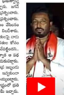
వర్గం కిద్దంపూడిలో ఆదివారం జరిగిన వాదనా విజయ భేరి" భారీ బహిరంగ సభలో పవన్ కళ్యాణ్ మాట్లాడుతూ వైసీపీ ప్రభుత్వం, సీఎం జగన్ రెడ్డిపై తీవ్ర ఆగ్రహం వ్యక్తం చేశారు.

వర్గం కిద్దంపూడిలో ఆదివారం జరిగిన వాదనా విజయ భేరి" భారీ బహిరంగ సభలో పవన్ కళ్యాణ్ మాట్లాడుతూ వైసీపీ ప్రభుత్వం, సీఎం జగన్ రెడ్డిపై తీవ్ర ఆగ్రహం వ్యక్తం చేశారు. కిద్దంపూడి సభ అంధప్రదేశ్ దళితులకు