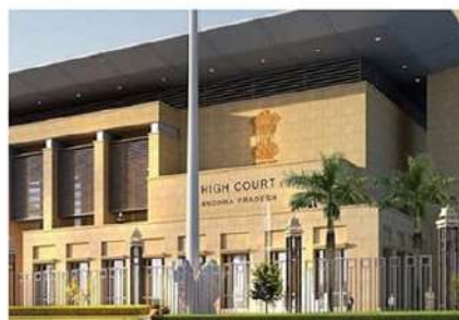
గ్రామంలో ప్రతాంత జీవనానికి అనుకూలమైన వాతావరణం కల్పించాలని ఈ సందర్భంగా పోలీసులను హైకోర్టు ఆదేశించింది.

చేశారు. మళ్లీ ఈ గ్రామాల్లో అడుగు పెడితే చంపేస్తామంటూ హెచ్చరించారు. దీంతో అధికారపార్టీ నేతల బెదిరింపులు తాళలేక వారంకా వేర్వేరు గ్రామాల్లో తలదాచుకుంటున్నారు. అటువంటి పరిస్థితుల్లో తమకు ప్రాణ రక్షణ కల్పించాలంటూ... బాధిత కుటుంబాలు హై కోర్టును ఆశ్రయించాయి. ఈ క్రమంలో న్యాయస్థానంలో పలుమార్లు వాదోపవాదాలు జరిగాయి. అందులో భాగంగా బాధిత కుటుంబాలకు రక్షణ కల్పించాలంటూ న్యాయస్థానాన్ని పిడివనర్ తరపు న్యాయ వారు కోరారు. పిడివనర్ తరపు న్యాయవాదుల వారసలతో న్యాయస్థానం ఏకీభవించింది. బాధిత కుటుంబాలకు రక్షణ కల్పించాలని,