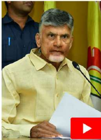
ఆమరావతి (చైతన్యరథం): పించన్ను దారులకు మే నెల పించన్న ఇంటివద్దనే ఇచ్చే విధంగా రాష్ట్ర ప్రభుత్వాన్ని ఆదేశించాలని కేంద్ర ఎన్నికల సంఘానికి టీడీపీ అధినేత చంద్రబాబు లేఖ రాశారు. ఈ నెలలో పించన్న పంపిణీలో ఆపిగెన పొరపాట్లు పునరావృతం