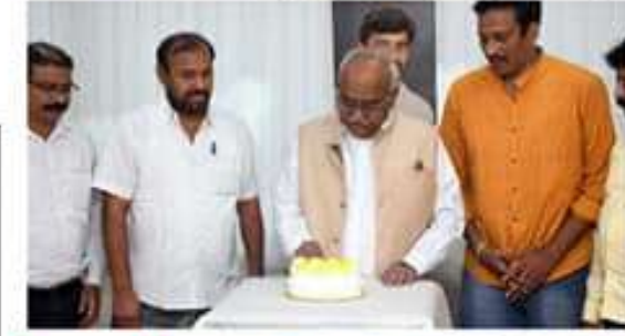
డీడీవీ మాత్రం అభ్యంతరం లేకుండా జన్మదిన శుభాకాంక్షలు తెలిపారు. అందుకు అనుగుణంగా ఉండాలని అన్నారు. అందుకు అనుగుణంగా ఉండాలని అన్నారు.

అనుభవం తెలియజేసిన సమావేశం, జగన్ రెడ్డి చంద్రబాబు నాయుడు అభ్యంతరం లేకుండా జన్మదిన శుభాకాంక్షలు తెలిపారు. అందుకు అనుగుణంగా ఉండాలని అన్నారు. అందుకు అనుగుణంగా ఉండాలని అన్నారు.