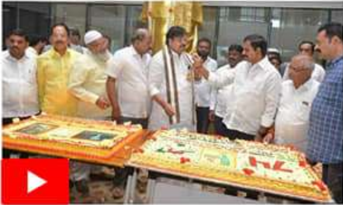
మహిళలందరికీ అన్న సంక్షేమం అప్పటి నేతలలోకి ఒక కర్మమీనాగా కార్యాలయంలో ముందుకు పాటు

అమరావతి(వైకాపా): టీడీపీ జాతీయ అధ్యక్షుడు చారా చంద్రబాబు నాయుడు పుట్టిన రోజు వేడుకలు ఘనంగా నిర్వహించారు. ఈ సందర్భంగా నేతలు భారీ కేక్ కట్ చేశారు. అనంతరం వారు మాట్లాడుతూ... మనకే రాజకీయ రంగంలో ఎన్నోమంది ప్రజాశక్తి, కార్యనిర్వహణ, ముందుగా 30 గల ఆరో కార్మికుల మంది నాయకుల్లో చంద్రబాబు నాయుడు ఒకరన్నారు. ఏప్రిల్ 2020 వేడుకో వేడు ఘన తెలుగు రాష్ట్రాల సాగుంలోనే అభివృద్ధికి పాతాళి దీక్షలు చేసిన రాజకీయ నేతలకు చంద్రబాబు. ఎన్నో చూపు కీర్తనలు 74వైపు చూపుతున్నా అని పెరుగుతూ మోడరన్ చంద్రబాబును ముందుకు నడుపుతుంది. ప్రజా సంక్షేమం కోసం, రాష్ట్రాభివృద్ధి కోసం చంద్రబాబు చేసిన కృషి, సేవలు వెలుగుతుంది. అప్పటి అందరికీకీ అభివృద్ధి పనిపాటులో, చంద్ర బాబు నాయుడు నిర్ణయించిన చంద్రబాబు ప్రశ్నల ప్రియం అంది. భారతదేశ చిట్టమంటే వేసిన అక్షరామీనా నిర్ణయించిన చంద్రబాబునే, కేవలం