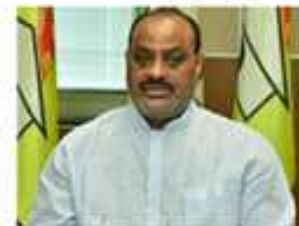
కేసీఆర్ మూలం చేస్తుంది అన్నారు.