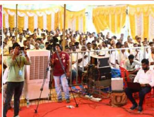
వ్యక్తిగతంగా తీసుకోవాలని భువనేశ్వరి కోరారు.