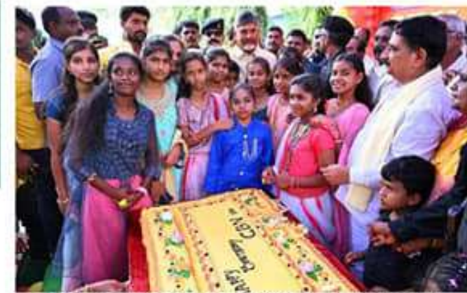
అనుభవం తెలియజేసిన సమావేశం, జగన్ రెడ్డి చంద్రబాబు నాయుడు అభ్యంతరం లేకుండా జన్మదిన శుభాకాంక్షలు తెలిపారు. అందుకు అనుగుణంగా ఉండాలని అన్నారు. అందుకు అనుగుణంగా ఉండాలని అన్నారు.