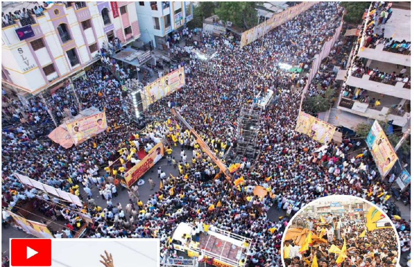
ఎమ్మిగనూరులో బాలకృష్ణ సభకు పాకినట్లైన అభిమానులు