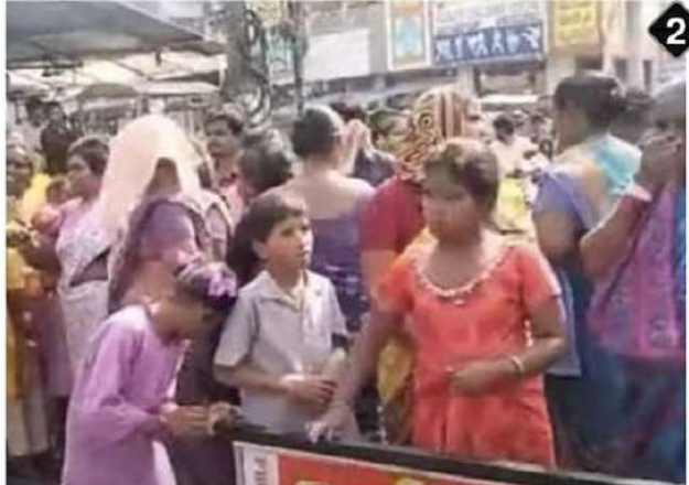
సీఎం జగన్మోహన్ రెడ్డి పనిలో తమవారిని అక్రమంగా నిర్బంధించారంటూ ఆందోళన చేస్తున్న విజయవాడ వద్దర కాలుషీవాసులు