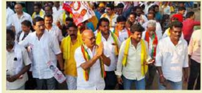
- జనసేన అధినేత పవన్ కళ్యాణ్ ను గెలిపించాలని పిలుపు