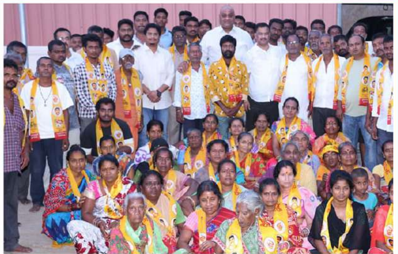
శ్రీకాకుళం జిల్లా టెక్నాలజీ వైస్సార్సీపీకి భారీ షాక్ తగిలింది. టెక్నాలి కంద్రవీధి నుండి 300 కుటుంబాల మత్స్యకారులు వైసీపీని వీడి టీడీపీ రాష్ట్ర అధ్యక్షుడు కింజరాపు అచ్చెన్నాయుడు సమక్షంలో గురువారం తెలుగుదేశం పార్టీలో చేరారు.