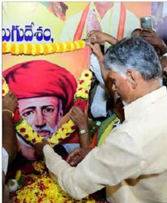
జ్యోతిరావ్ పూలే స్ఫూర్తితోనే బీసీలకు మరిన్ని హామీలు ఇచ్చాము. మేము అధికారంలోకి వచ్చాక బీసీలకు 50 ఏళ్లకే నెలకు రూ. 4,000ల పింఛన్ ఇస్తాం...1

అమరావతి(చైతన్యరథం): ఆధునిక సమాజంలో 'కుల నిర్మూలన' ఉద్దేశాలకు బీజం నాటిన తొలితరం సామాజిక సంస్కర్త జ్యోతిరావ్ పూలే అని తీడీపీ అధినేత చంద్రబాబు కొని యాచారు. సమసమాజ స్థాపనకు స్ఫూర్తిప్రదాత, మహాత్మా జ్యోతిరావ్ పూలే జయంతి సందర్భంగా గురు వారం ఆ మహనీయుని స్మృతికి నివాళులు అర్పించారు. ఆ మహాశయని స్ఫూర్తితోనే బదుగు బలహీన వర్గాలకు రాజకీయాల్లోనూ, అధికారంలోనూ ప్రాధాన్యం కల్పించి, బీసీల పాస్టిగా తెలుగుదేశం పేరుగాంచినవ్వారు. వెనుకబడిన వర్గాలకు ఉపప్రధానిగా తెచ్చిన ఘనత తెలుగుదేశానిదే అని చెప్పుకోగలగలనట్లుగా... అందుకు ప్రేరణ పొందింది కూడా పూలే ఆశయాల సుంచేసిన చెప్పారు.