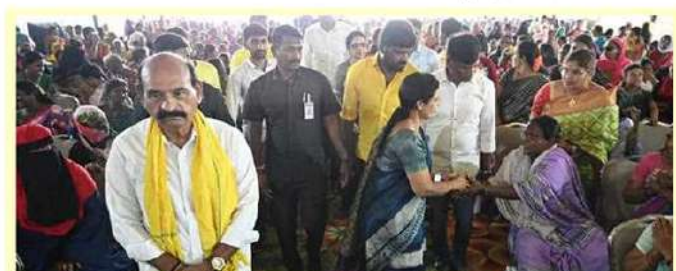
టీడీపీ పాలనలో ముస్లింలకు పలు సంక్షేమ పథకాలు

దాన్ని ఆయన నిలబెట్టుకుంటారు. కానీ వైసీపీ ప్రభుత్వం అధికారంలోకి వచ్చాక 45 ఏళ్లు నిండిన మహిళలకు పెన్షన్లు ఇస్తామని చెప్పి నేటికీ అమలు చేయలేదు. ముస్లిం మహిళలకు దుల్లబ పథకాన్ని రద్దు చేశారు. నవీన్ శా అమలు చేస్తామని మాట తప్పారు. నూనెపట్టి గ్రామం, 21వ వార్డులో రైల్వే ప్రాజెక్టును వైసీపీ ప్రభుత్వం వర్ధిల్లించుకోవడం వల్ల అనేక మంది అమాయకులు ప్రాణాలు కోల్పోతున్నారు. 80కాతం వక్స్ టోర్లు భూములను వైసీపీ నేతలు అక్రమించేశారు. వక్స్ టోర్లకు సంబంధించిన దాదాపు 30వేల ఎకరాలను కబ్జా చేశారు. ప్రాధాన్య స్థలాలు, శుభానవాటికల స్థలాలను కూడా వైసీపీ నేతలు