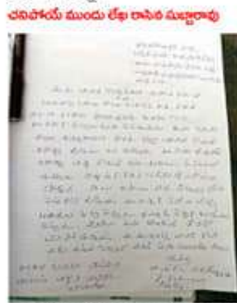
అభ్యుపాధ్యక్షుల ముందు పాల సువ్వాధావు వారికి వచ్చి జగన్ పోరాటం చూచారు. ఆ కేసులో..