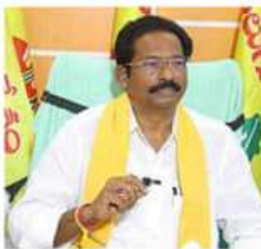
మొరటి సైరంలో ఉంది... నేను ఏమీ జగన్ రెడ్డి గుణాలు, డ్రగ్స్ రూపంలో ప్రభుత్వం పేర్కొన్నారు అలాంటి వ్యక్తం చేశారు. డ్రగ్స్ మాత్రమే అనుభవం విదేశాలవారి వచ్చిన జిల్లా టీడీపీ అధినేత చంద్రబాబు మాత్రం విజయం వచ్చి చెప్పారు. టీడీపీ అధినేత చంద్రబాబు మాత్రం విజయం వచ్చి చెప్పారు.