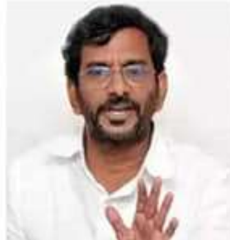
చేసేందుకు ప్రయత్నిస్తున్న మార్గాన్ని రాష్ట్రం నుంచి తరిమివేయాలని ప్రజలుగా నిర్ధారణ ఉన్నారని రాష్ట్రంలో చెప్పారు.

రాష్ట్ర పోలీసులు విజయసాయిరెడ్డిని విమర్శించి రాష్ట్రం తప్పకుండా ఉంది. ఈ డ్రగ్స్ వ్యవహారం విమర్శ జగన్ రెడ్డి అన్నారు. విజయసాయిరెడ్డి వారిని చెప్పకుండా విజయసాయిరెడ్డి 2016 ముందీ ఎంపీగా ఉండి తిర్రుగు ఏం రేఖలో సమాధానం చెప్పాడు. విజయసాయిరెడ్డిలో వచ్చిన రీతవేషం విజయసాయి రెడ్డి, నేం కోర్టు దావాలు ప్రజలు నామ్మ దీక్షలు 16 నెలలు చెప్పారు తప్ప విజయసాయిరెడ్డికి నీటిని చెప్పకుండా వచ్చింది. విజయలో ఒక్క నీటిని కూడా వైసీపీ గానీ వచ్చింది లేదు. మంత్ర రోజు జులై వరకు తన తాళం సంబంధించి ఒక్కసారి కూడా సజ్జు చేయించి లేదు తన తాళం ఏం అనుభవించి కూడా అవుతుంది తెలిపారు. కానీ, నోటీసులను వేరేదానిలో మాత్రం ముందుకుంది. జగన్ రెడ్డి కోల్ తాడు జిల్లో అని మరో 40 రోజుల్లో ప్రజలు వివరించినట్లున్నారు. రాష్ట్రాన్ని నిర్భాగం చేసిన జగన్ రెడ్డి లాంటి వ్యక్తులకు కిట్ల అంటే జగన్ రెడ్డి కూడా లేదు. తర్ఫీది చర్యం, గుణాలు, డ్రగ్స్ లో సమాచారం నాశనం