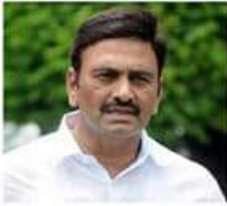
మహాశివ్ విరాళం కోసం 25 వేల కోట్లను మళ్లించాలని ప్రకటించిన ఘన కుట్రకు రేపటికీ ఆ...