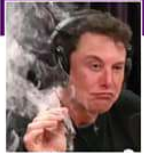
ట్రగ్స్ తీసుకున్నది నిజమే. ట్రగ్స్ తీసుకున్నది నిజమే.