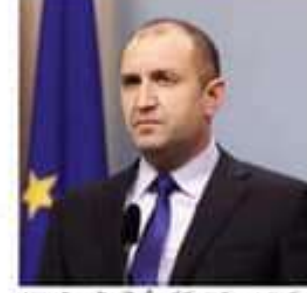
బల్గేరియా అధ్యక్షుడు భారత నౌకాదళానికి కృతజ్ఞతలు తెలిపారు.

బల్గేరియా అధ్యక్షుడు భారత నౌకాదళానికి కృతజ్ఞతలు తెలిపారు. బల్గేరియా అధ్యక్షుడు భారత నౌకాదళానికి కృతజ్ఞతలు తెలిపారు.