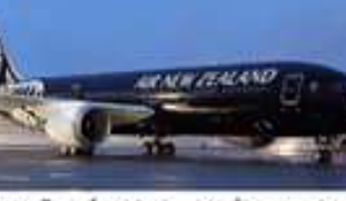
విమానం నుండి లావుగా ఉన్నారని విమానం నుంచి దించేశారు.

విమానం నుండి లావుగా ఉన్నారని విమానం నుంచి దించేశారు. విమానం నుండి లావుగా ఉన్నారని విమానం నుంచి దించేశారు.