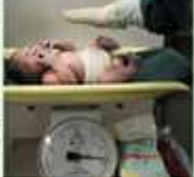
చైనాలో జననాలు తగ్గిపోయాయి.

చైనాలో జననాలు రేపి రోజు రోజుకు తగ్గిపోయింది. ఇది ప్రపంచ దేశ స్థాయి నేడుకుంది. చైనాలో భారతదేశానికి కంటే తక్కువగా జననాలు జరుగుతున్నాయి. ఈ సందర్భంలో చైనాలో జననాలు తగ్గిపోయాయి. ఈ సందర్భంలో చైనాలో జననాలు తగ్గిపోయాయి.