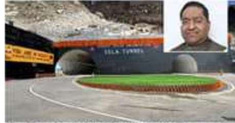
చైనాకు భారత్ ధీమత జవాబు. రష్యా దేశం (అంగ్లాండ్) తమ దురాశయాలను అంతరించాలి.

రష్యా అనుబంధ ప్రదేశ్ మొండి వాదనలు మానండి. రష్యా దేశం (అంగ్లాండ్) తమ దురాశయాలను అంతరించాలి. రష్యా భారత్ అనుబంధ ప్రదేశ్ మొండి వాదనలు మానండి. రష్యా దేశం (అంగ్లాండ్) తమ దురాశయాలను అంతరించాలి. రష్యా భారత్ అనుబంధ ప్రదేశ్ మొండి వాదనలు మానండి.