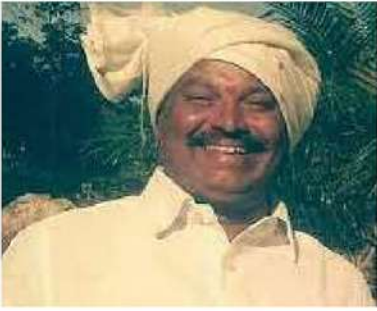
బీడీపీ నేత గుంటుపల్లి